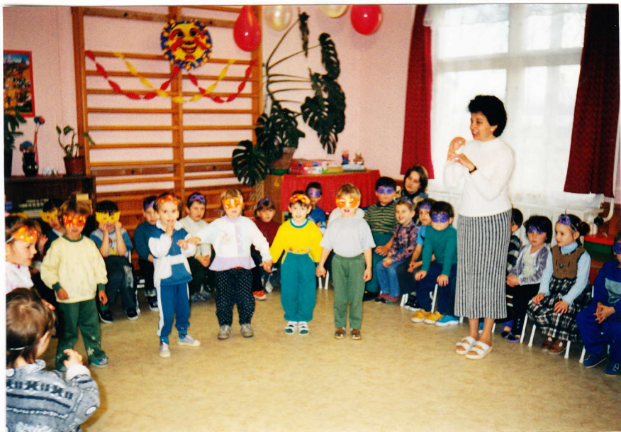
A kiscsoportos óvodások műsora

Pénteken az eszem-iszom után, 9 órakor kezdődött a dínomdánom. A nagyok szobájában minden csoport elmondta-elénekelte az eddig tanultak közül kiválogatott legréfásabb verseket,