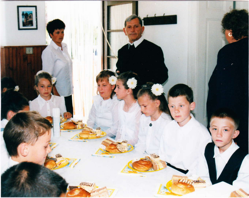
Az elsőáldozók vendégül látása