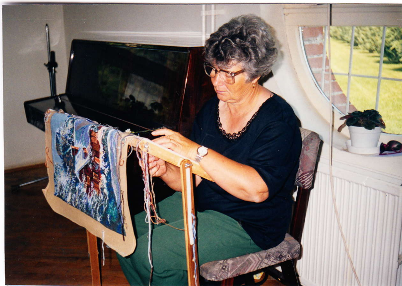
Konczné a helyszínen is bemutatta a készítési folyamatot

Az érdeklődők a készítési folyamatot is láthatták, hiszen Konczné bemutatta egy nagy méretű kép hímzését.