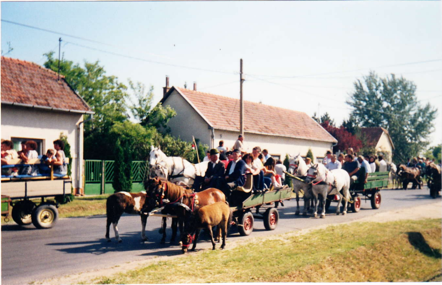
Hosszú sorban haladt a felvonulás