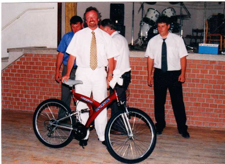
Egy német vendégnek kedvezett a szerencse

Ezen eseményeket követően a szerencséje függvényében ki boldogan, ki enyhén lelombozódva folytatta korábbi tevékenységét virradatig.