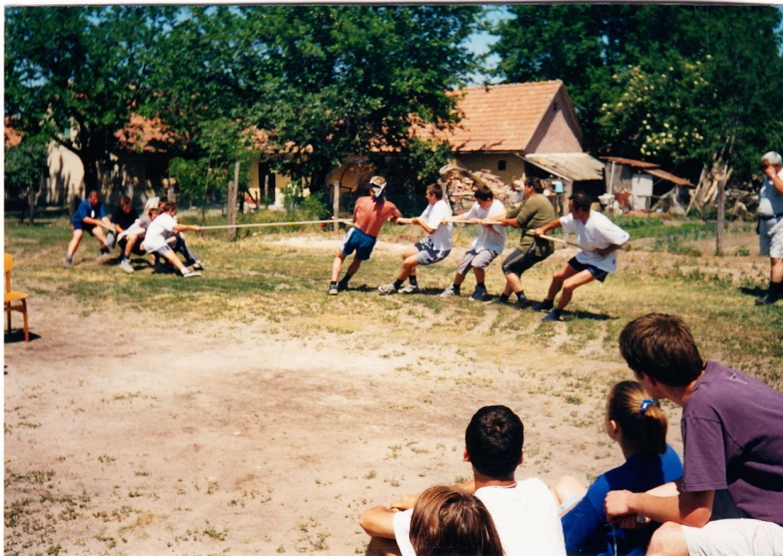
Kötélhúzásban is megmérkőztek a torta-túrások