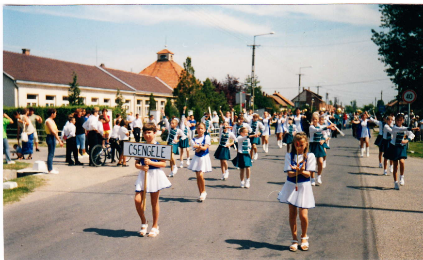
A csengelei mazsorették vezették a felvonulást

Ebben az évben Makó és Székesfehérvár együttesesei kaptak meghívást tőlünk. Sajnálatos, hogy utóbbiak az utolsó pillanatban lemondták szereplésüket.