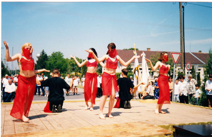
Hastáncosokat is láthatott a közönség

Ebéd után a fúvószenekarok és mazzorett csoportok térzenét adtak. Az indulóktól a modern könnyűzenéig minden megtalálható