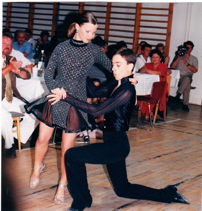
A kisteleki táncosok nagy sikert értek el

A jóllakásért vívott harcunk romjainak eltakarítását követően a színpad előtti teret a kisteleki Pro Art táncsoport vette birtokába. A különböző versenyeken díjakat nyert tagok legfiatalabbika 8 esztendőes volt. A legidősebbek a több éves gyakorlás eredményeként természetes, hogy profi szinten adták elő a számomra eszméletlenül nehéz lépéskombinációkból koreografált műsorszámukat. Na, de a kisebbek sem maradtak el mögöttük! Szakmai ártalom nálam, hogy leginkább őket figyeltem, a jövő előhírnökeit. Úgy vélem, ha majd elérik a most látott "öregek" életkorát, kenterben verik az ő jelenlegi teljesítményüket.