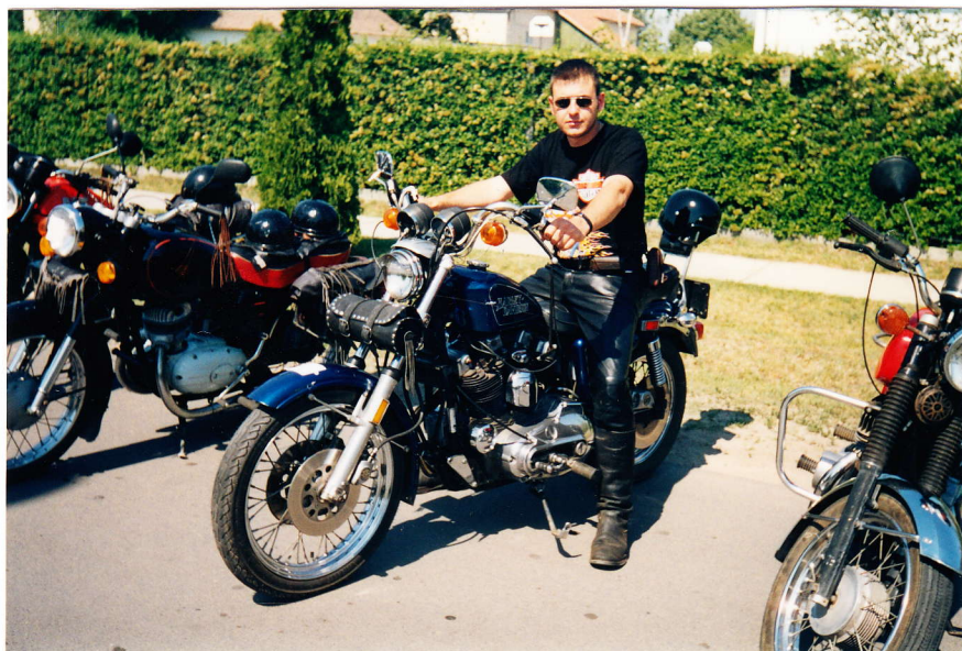
Egy Harley Davidson-os a motorosok közül

Az idén osztottunk ki először három kupát. Veteránok közül egy Csepel volt a legöregebb. A szépségdíjat egy egyedi festésű Suzuki Intruder kapta. Közönségszíjás egy gyorsasági Suzuki lett.