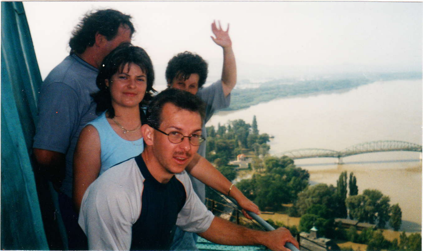
Szép kilátás nyílt a bazilika tetejéről

Másnap délelőtt Esztergomba mentünk várost nézni. Szerencsére a vízállás folyamatosan csökkent, így már a buszon utazva kelhettünk át a vizes útszakaszon. A kirándulók nagy része a bazilikával kezdett, majd a bátrabbak felmentek a kupolán lévő kilátóra. Onnan pontosan szemügyre lehetett venni, hogy a város mely részei vannak víz alatt, és szép panoráma nyílt a szlovákiai Párkányra is.