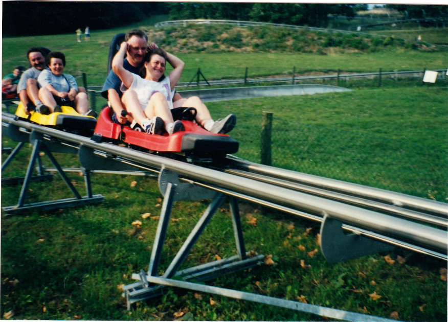
Nyári bobbal száguldozva a hegyoldalon

A következő állomás a nyári bobbpálya volt. A hegyoldalon leguruló kiskocsik először sokunkban tartózkodást váltottak ki, de az első kör után már nem győztük a jegyeket vásárolni.