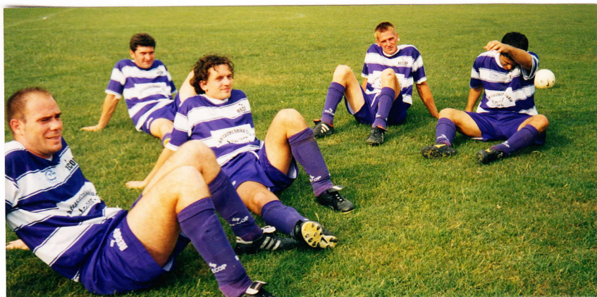
Vége a bajnokságnak, megpihenhetnek a focisták

- Egy hónapja 20-22 gyerek - 12-13-14 éves korú - vesz részt minden pénteken a futballpályán az utánpótlás csapat edzésén. Nekik versenyzési lehetőséget is szeretnénk biztosítani.