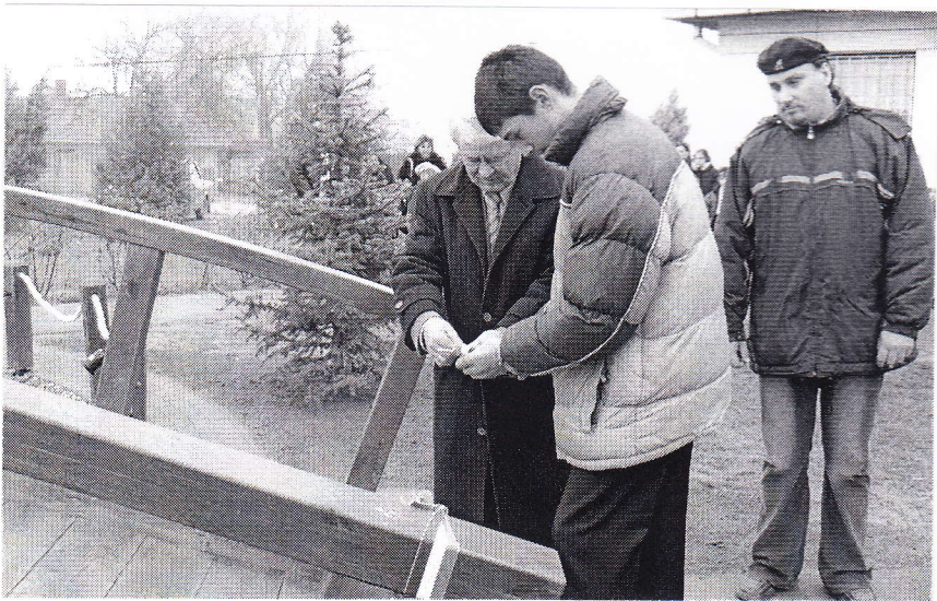
A díszburkolat és a fahíd ünnepélyes átadása december 8-án