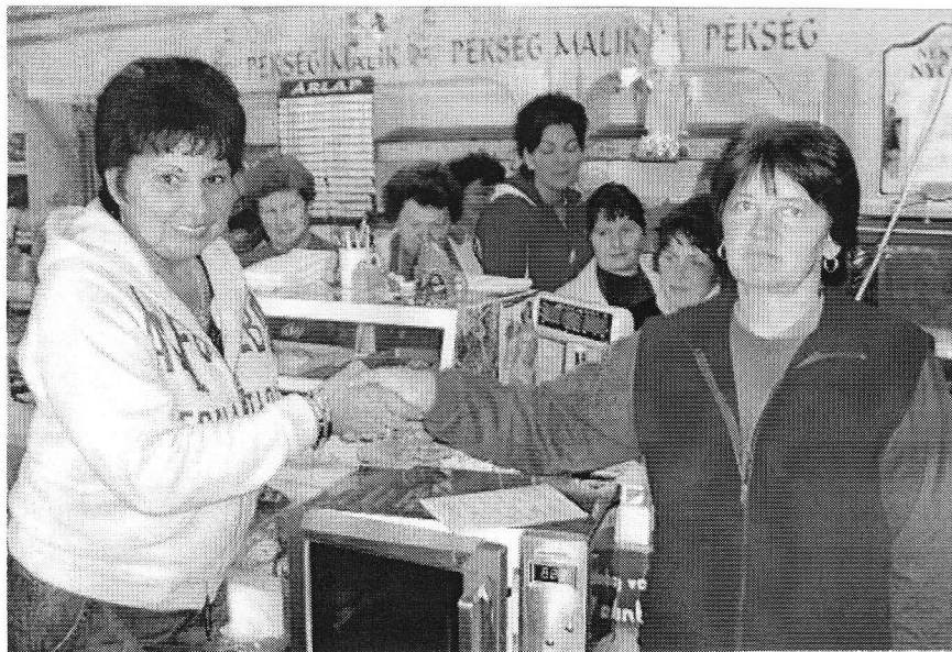
Főnőkasszony a fődíj nyertesével