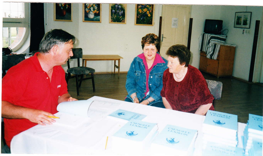
A falunapokra megjelent könyv dedikálása