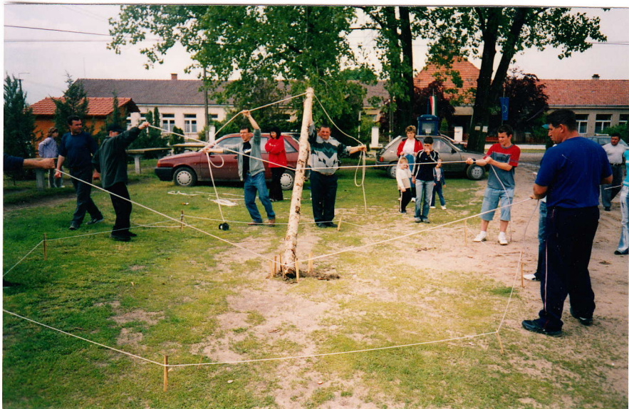
Oszlopállítás kötelek segítségével