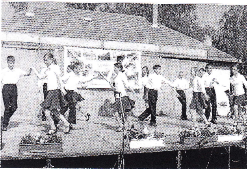
A csengelei társastáncosok fellépése (fotó: Törköly Ágnes)