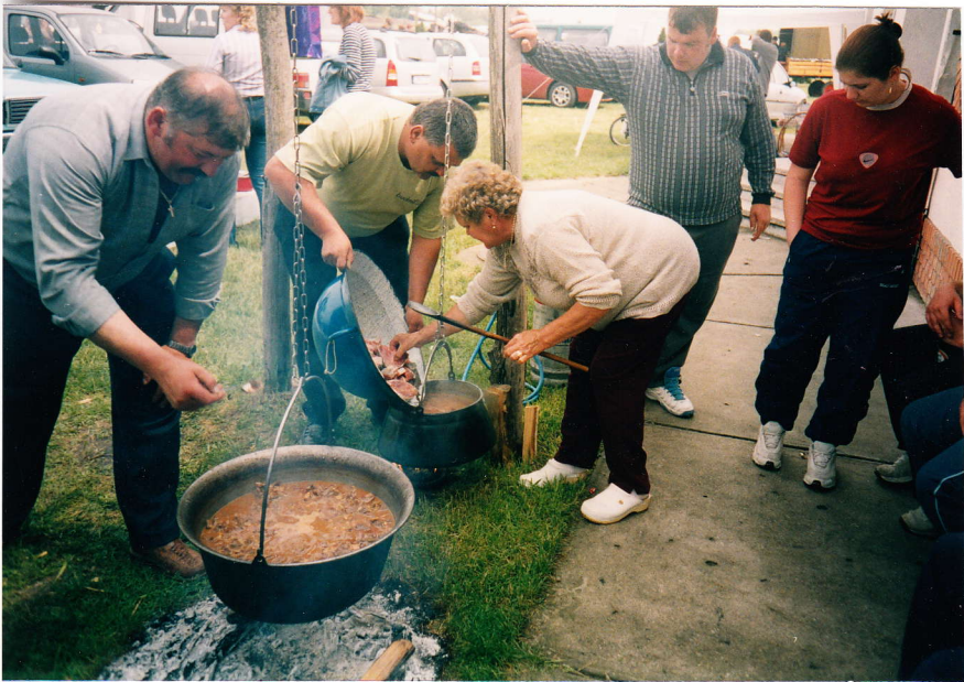
Rotyog az étel a bográcsokban