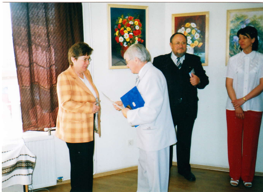
A polgármester elismerő okleveleket adott át a kiállítóknak