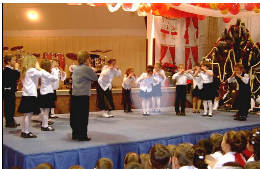
A nagycsoportos óvodások műsora

A kis óvodásoktól kezdve a legnagyobb szereplőkig elkápráztattak bennünket. Öröm volt látni azt, hogy milyen fejlődésen men-