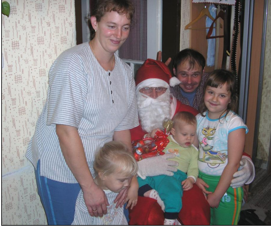
Vendéglátás a Balog családban

Szent Miklós napján újra ellátogatott a csengelei polgárőr gyerekekhez a Téliapó. A jó idő miatt nem szánon, hanem a polgárőrség gépkocsijával járta a házakat, két csúnya krampusz társaságában. Mindenhol szíves fogadtatásban részesültek, sok helyen énekszóval köszöntötték. Bizonyára mind a 24 gyermek jó magaviseletű lehetett, hiszen mindenhol csak ajándécsomagot kaptak, virgácsot sehol sem hagytak az ördögfiókák.