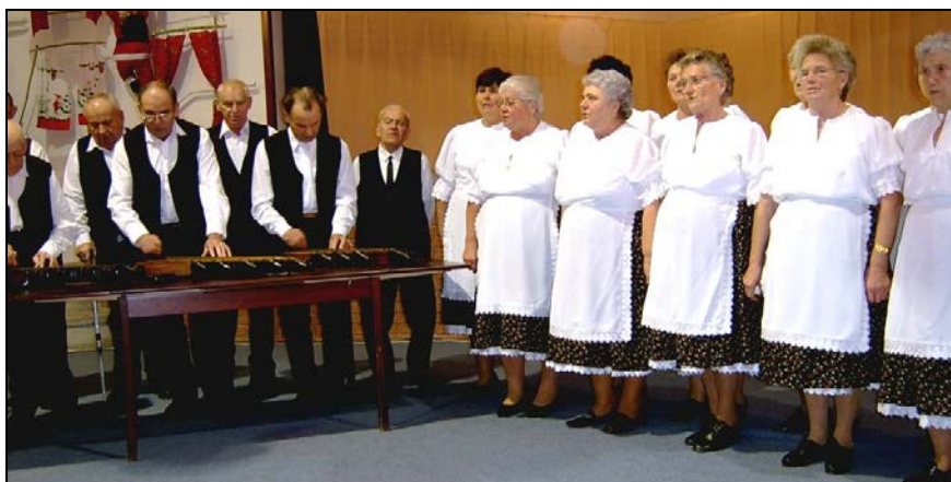
A citerazenekar és a népdalkör is fellépett