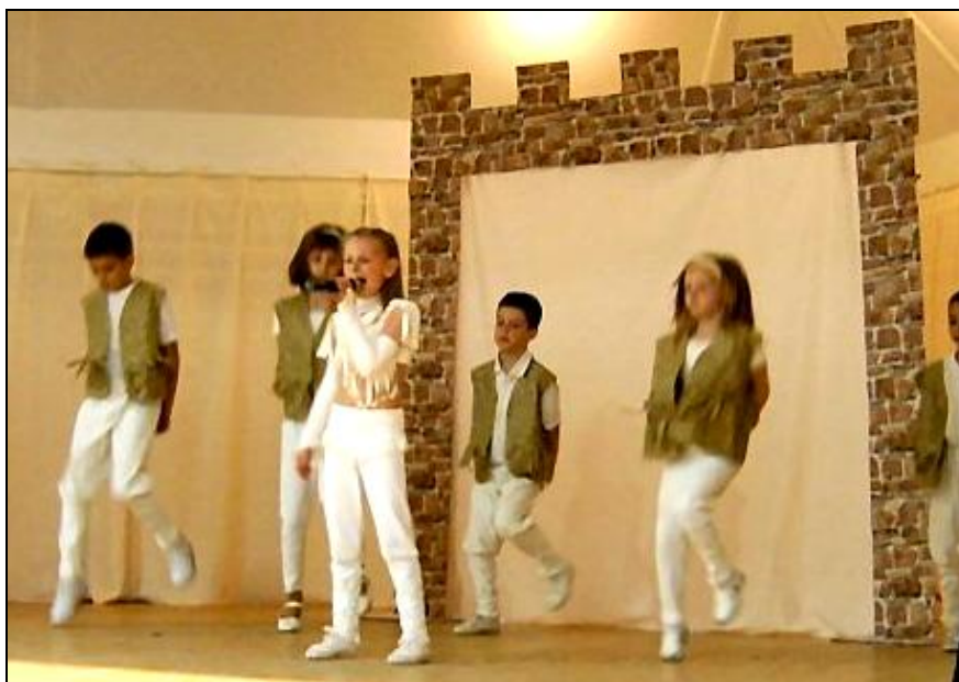
A Mini NOX együttes nagy sikerrel szerepelt

Ő a nyugdíjas klub rendezvényein szokott szavalni. A nyugdíjas évekről szóló "Beszélgetés az Úristennel" című költeményt adta elő.