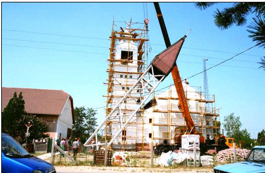
Megy a torony vándorútra