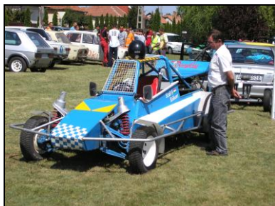
Egy épített versenyautó