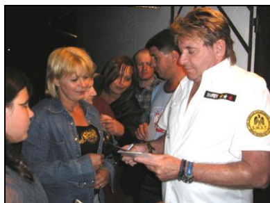
A magyar rock & roll király