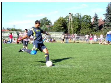
Egy 11-est rúgó versenyző