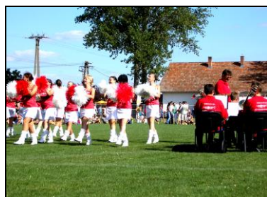
Mazsorették a focipályán