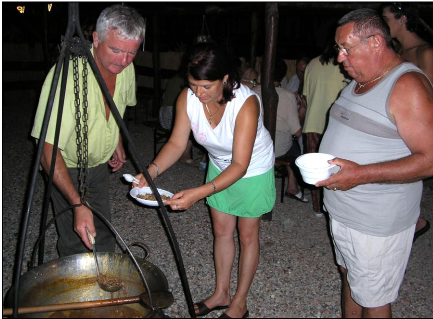
Szépen fogy a zúzapörkölt

Az idei kirándulás célpontja a román határnál lévő Gyula városa volt. A polgárőrökkel, és azok családtagjaival megtelt a busz, 40 fős társaság indult útnak. Mint általában, most is gondok voltak a sok-sok csomag elhelyezésével, de a találékony önkéntes bűnmegelőzők ezt a problémát is megoldották.