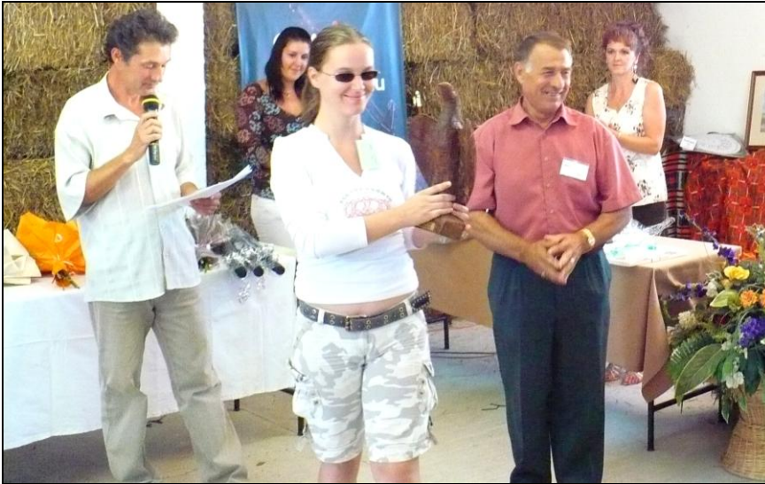
Az ifjú filmes hölgy Vincze János díjával

minden szobor számomra egy élet, egy világ. És csak nézegetem őket. Köszönjük!