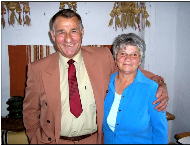
A két csengelei az algyői kiállításon