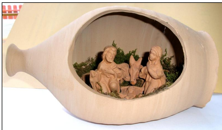
Olasz ajándék a csengeleieknek: cserépből készült Betlehem

minden reggel a résztvevőknek tartok egy pár perces elmélkedést. 5-10 percben elmondom Szent Pál apostol életét, tanításának a főbb vonalait, lényegét. Utána indulunk el, és nyakunkba vesszük a várost. A zarándoklat annyiban különbözik a kirándulástól, hogy nem csak azért megy el az ember ilyen messzire, hogy szépeket lásson, hanem hogy közelebb kerüljön Istenhez. Az a célunk, hogy akik eljönnek velünk, azok közelebb kerüljenek Istenhez. Elmegyünk Róma legfontosabb templomaiba. Ott imádkozunk, nem csak körbenézünk.