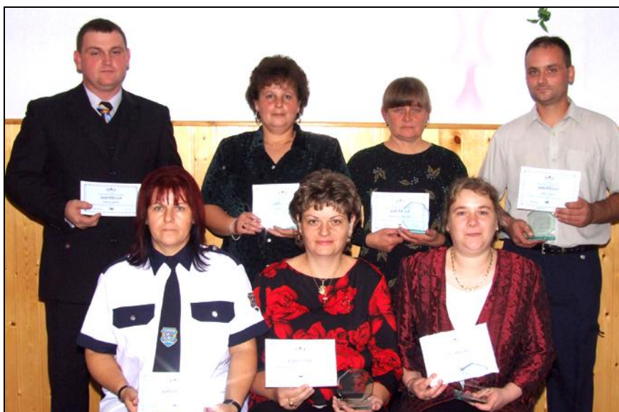
Polgárőrök az 5 éves szolgálat után járó emléklappokkal