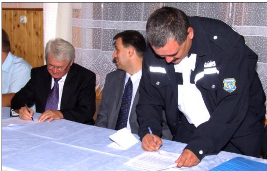
Az együttműködési megállapodás aláírása