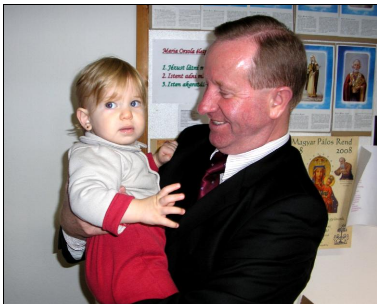
A Nowa Slupia-i polgármester az egyik Katona lánnyal

is természetnek. Kukorica és cukorrépa nálunk ugyan nincs, de nem túl messze viszont foglalkoznak vele.