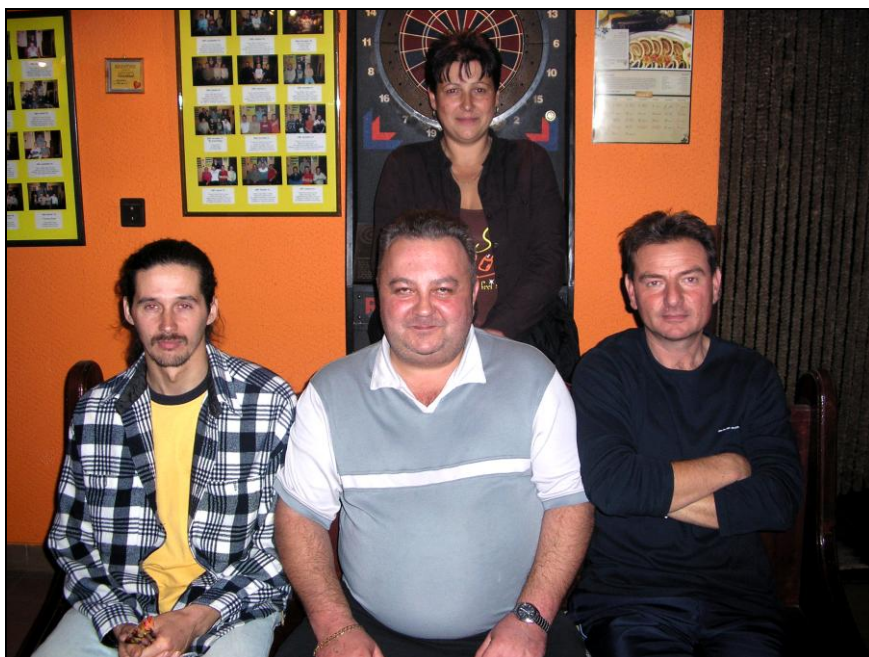
Három bajnok a szervezővel