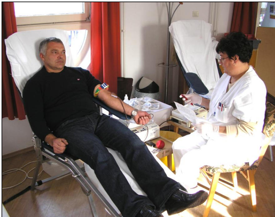
Egy csengelei önkéntes véradó

December 2-án a Faluházban rendezett véradáson 14 csengelei polgár jelent meg, akik mind régi véradók voltak. Senkinél sem tapasztaltak kizáró okot, így minden jelentkező adhatott vért.