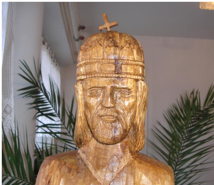
A szobor egy részlete