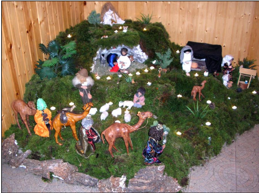
Az ünnepség helyszínén felállított Betlehem