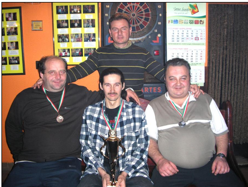
Az első három helyezett a kupa felajánlóval