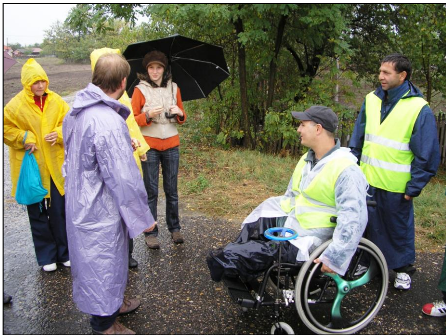
Pihenő az esőben

Fogadtatásukat Katona Attila hitoktató szervezte meg. A falutól kb. 6 kilométerre várták a zarándokokat a csengeleiek, köztük négy 7. osztályos lány. Az esővel mit sem törődve jó hangulatban baktatott a kis csapat a belterület irányába. Útjukat a csengelei polgárőrök is biztosították.