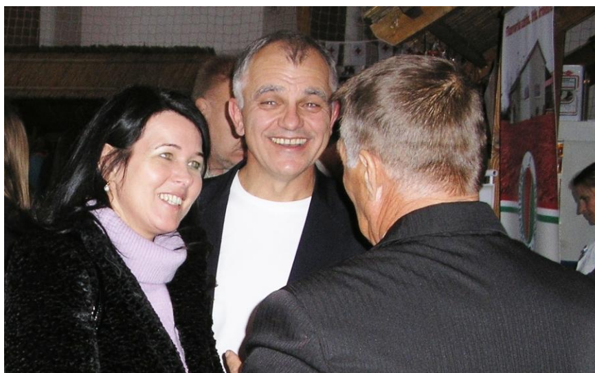
Barátságos beszélgetés a FIDESZ-alelnökkel és a polgármesterrel

„Gratulálok az elért eredményekhez. Csodálatos faragványok, csodálatos pillanatok, csodálatos munka. Adjon az Isten Ön-