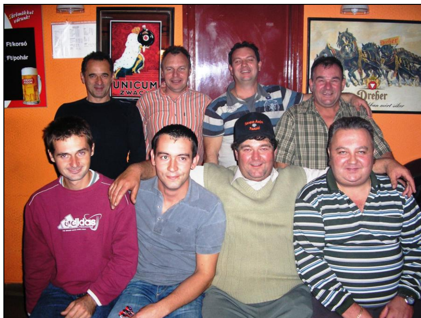
A szegediek az álló, a csengeleiek az ülő sorban

is szereti. A Korona söröző tulajdonosai október 31-re meghívták a régi ellenfeleket, akik megmérkőztek a helyiek képviselővel.