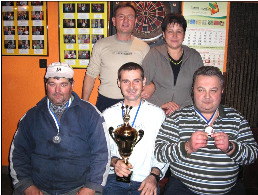
A III. Gábor Kupa érmesei a szponzorral és a szervezővel