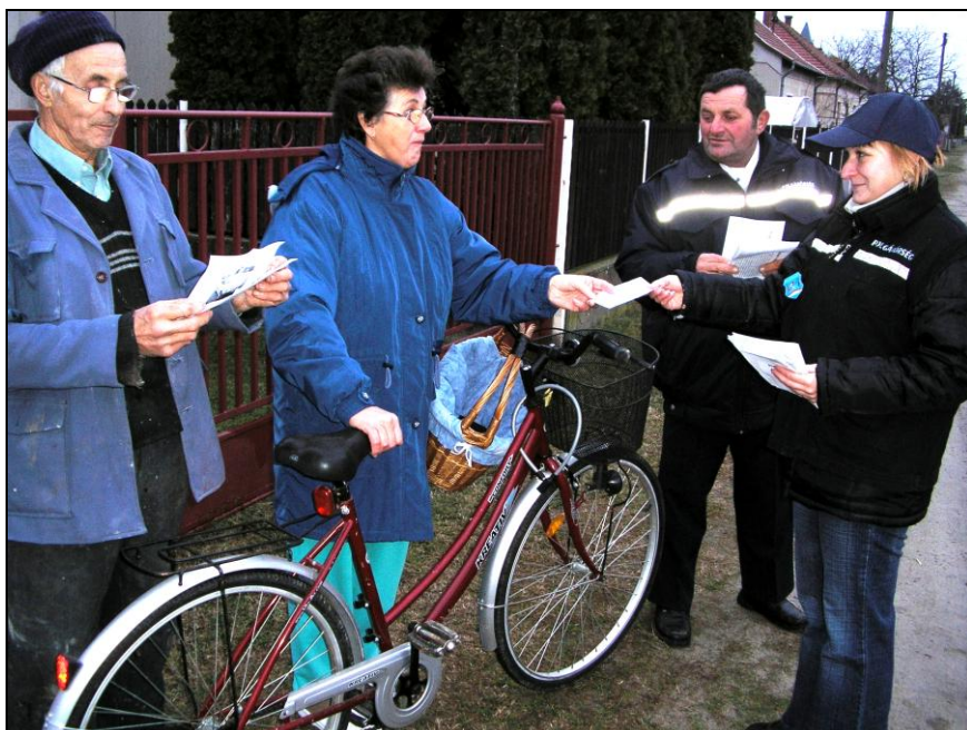
A bűnmegelőzési akcióról szóló írásunk a 6. oldalon olvasható!