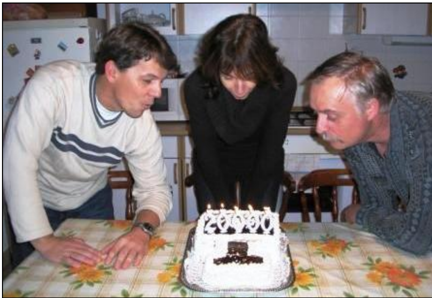
A jubileumi torta gyertyáinak elfújása

A nem egészen másfél év alatt nagy olvasótáborra tett szert a „Csengelei információk”. Ezt jelzi, hogy ez év december 11-én töltötték le a 20 ezredik oldalt erről a weboldalról.