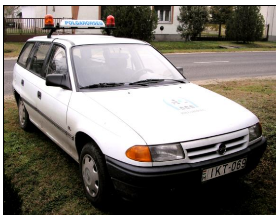
A csengelei polgárőr szolgálati gépkocsi

kívül (falunapok, sportnap stb.) csak helyi polgárőrök tevékenykednek. Ők egy fehér színű Opel kombival közlekednek, melynek tetején fehér alapon kék betűvel a POLGÁRŐRSÉG felirat látható, amit sötétben kivilágítanak. Szintén a kocsi tetejére két sárga színű villogó is fel van szerelve. A polgárőröknek nincs hatósági jogosultságuk, senki sem köteles a lakásába beengedni őket.