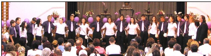
A búcsúzó nyolcadikosok

Attiláné és Sántáné Czombos Mónika sokéves munkáját.