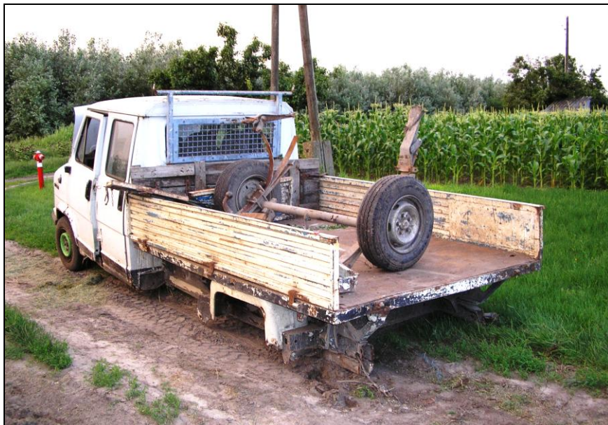
A hátsó kerekek fenn a platón

Június 30-án kora este egy kisteherautó beletolatott az óvoda melletti parkolónál lévő betonárokba. Hogy miként juthatott oda, az rejtély, hiszen a vízelvezető előtt még egy magas betonpadka is van, de azt sem vette észre.