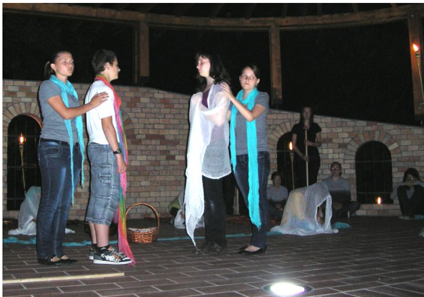
A felsős színjátszók szabadtéri előadása