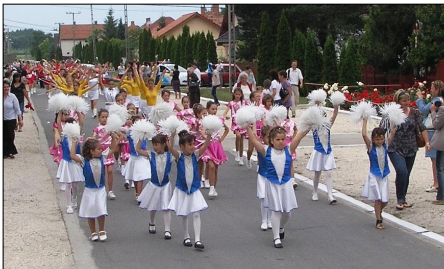
A mazsorették visszaérkezése