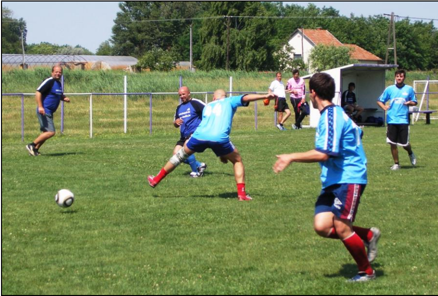
A kupagyőztes Reál Margit vívja egyik mérkőzését

hette át a vándorkupát, és mellé annak kicsinyített változatát. Második helyen a Mono-Pool Team végzett, míg a harmadik a Porsche tolvajok lettek.