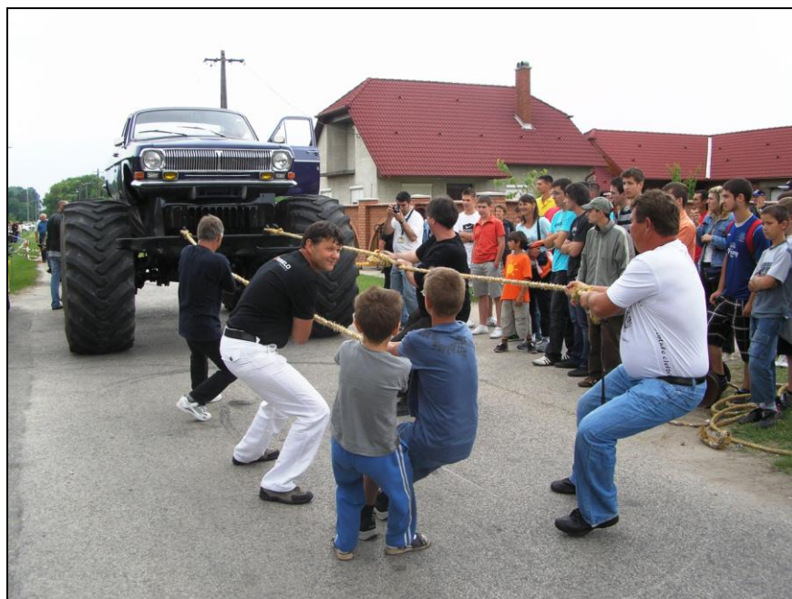
Üzemanyag-takarékos vonatatási mód