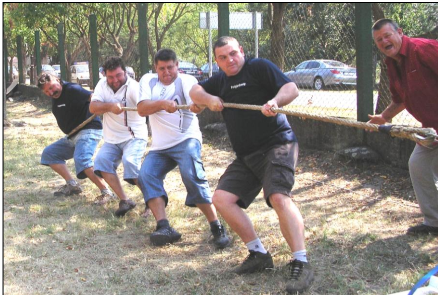
Munkában a kötélhúzó bajnokok

Május 27-én rendezték meg a kisteleki vásártéren a XIII. Csongrád megyei polgárőr napot. A sorszám baljóságát is erősíti, hogy harmadszorra sikerült csak összehozni a megyei seregszemlét.