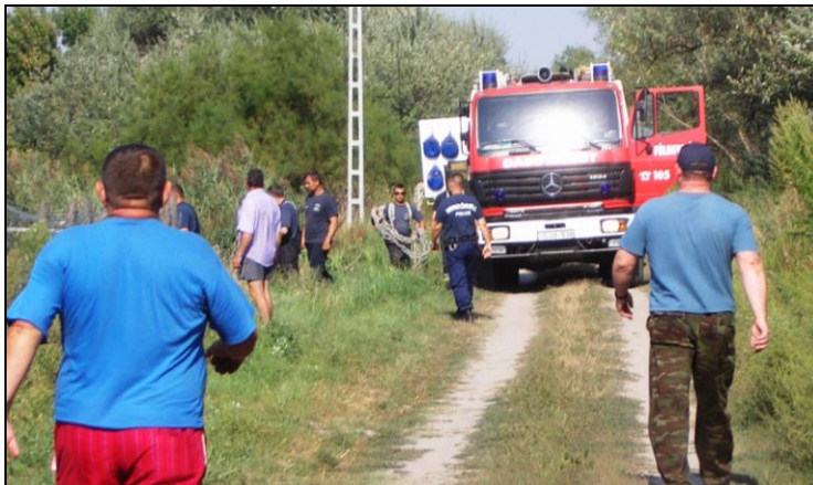
Indul az eltűnt személy keresése