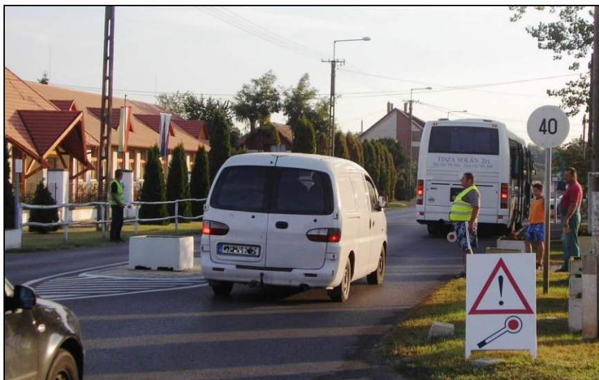
Munkában a polgárőrök