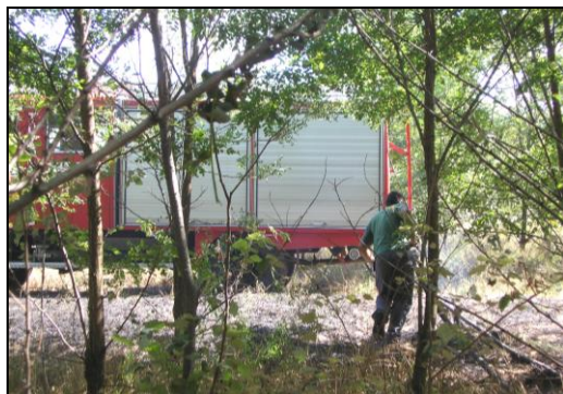
Erdőben oltották a tüzet