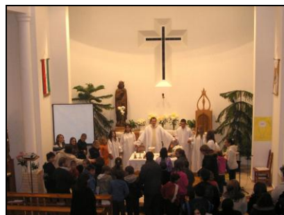
Körbeállták az Úr asztalát (fotók: Molnár Mihály)