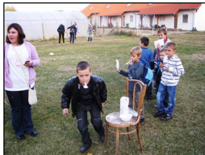
Újfajta liszthordási módszer