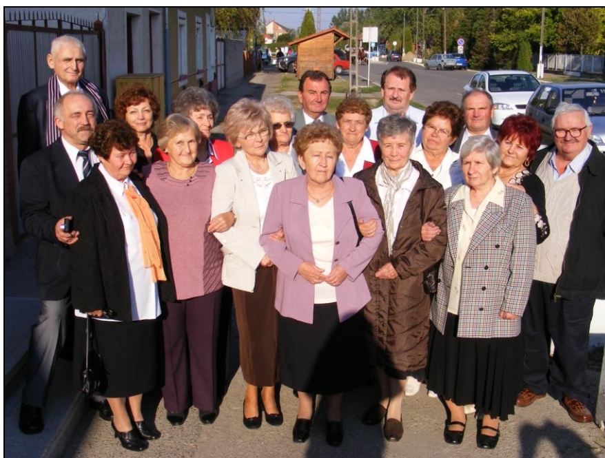
Az ötven éves iskolai találkozó résztvevői