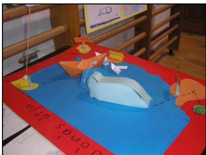
Jónás és Csengele kapcsolata