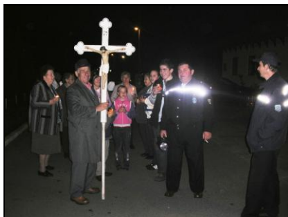
Indul a fáklyás körmenet