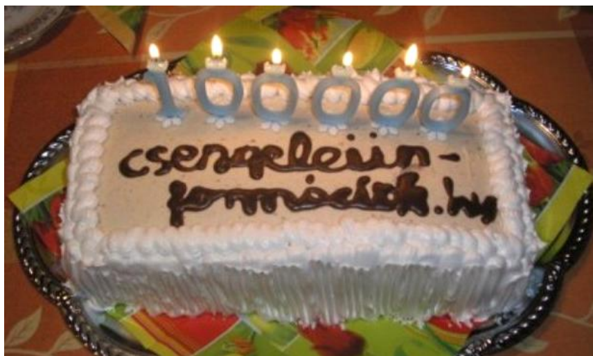
A százezres jubileumi torta