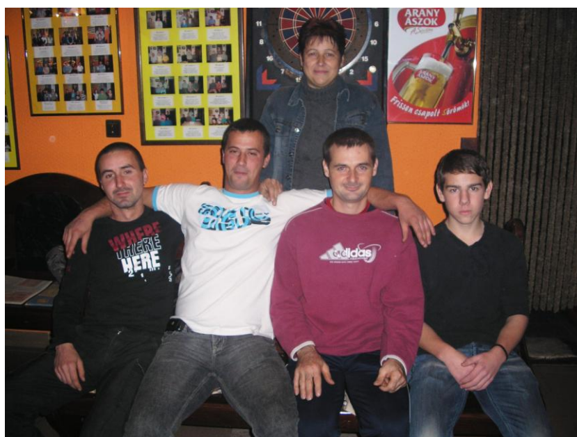
Bajnokok a szervezővel