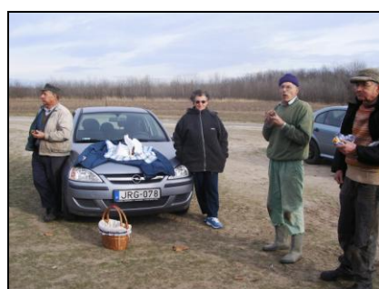
Jól esik a friss kalács