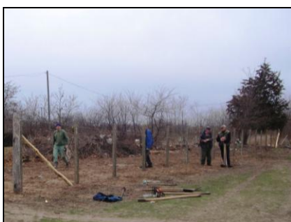
Sok oszlop újra a földben