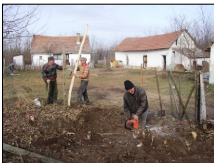
Folyik az oszlopállítás