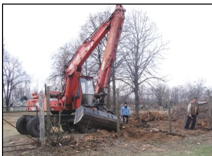
Markoló húzta ki a tuskókat