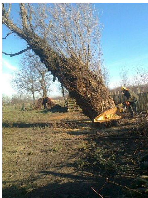
A még álló, és a már dőlő nyárfa