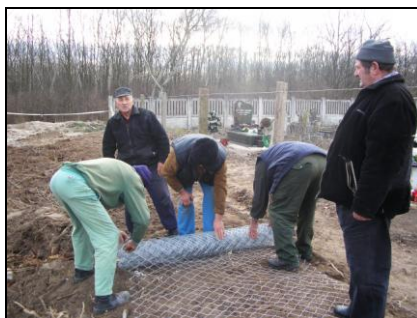
Már a dróthálón a sor