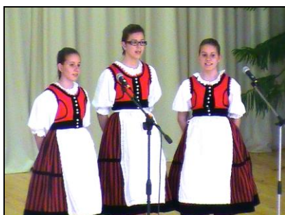
Három ifjú népdalénekes