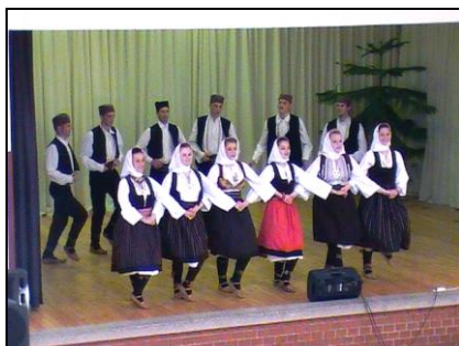
A Bánát néptáncsoport