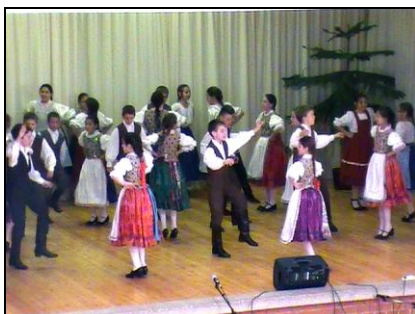
A Belice néptáncsoport