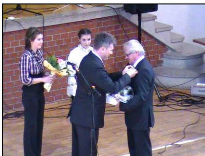
Deszki jelvény a hajtókára