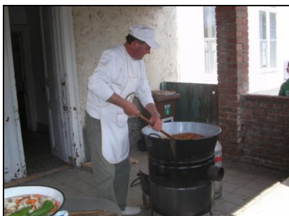
Készül a gulyásleves