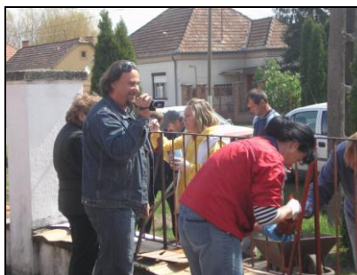
Videós tudósító munkában