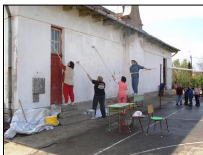
Meszel a tanári kar