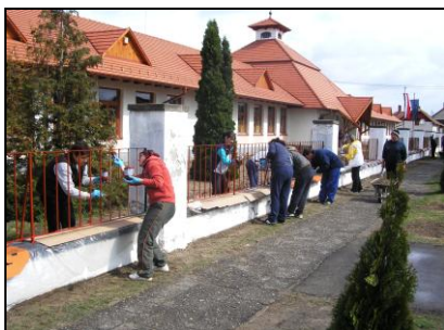
Indul a kerítésfestés