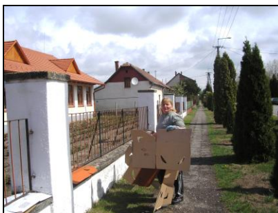
Táncstanár most más munkakörben