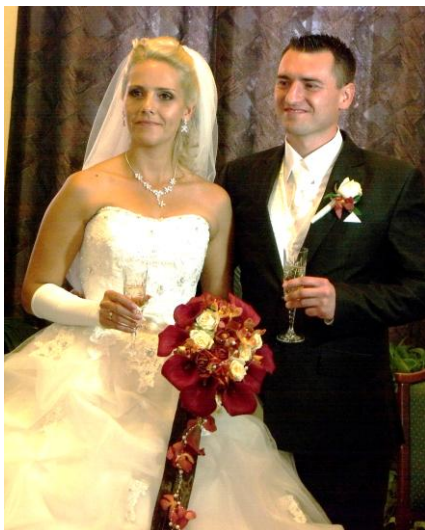
Az ifjú házaspár esküvői fotója

Hozzaadottétedet allokucióból 202-202 boldogságot, unalmasabb unalót, együtt induti megbecsülést, tiszteletet, boldogságot és egy boldog párost hívom Anyu Apa.