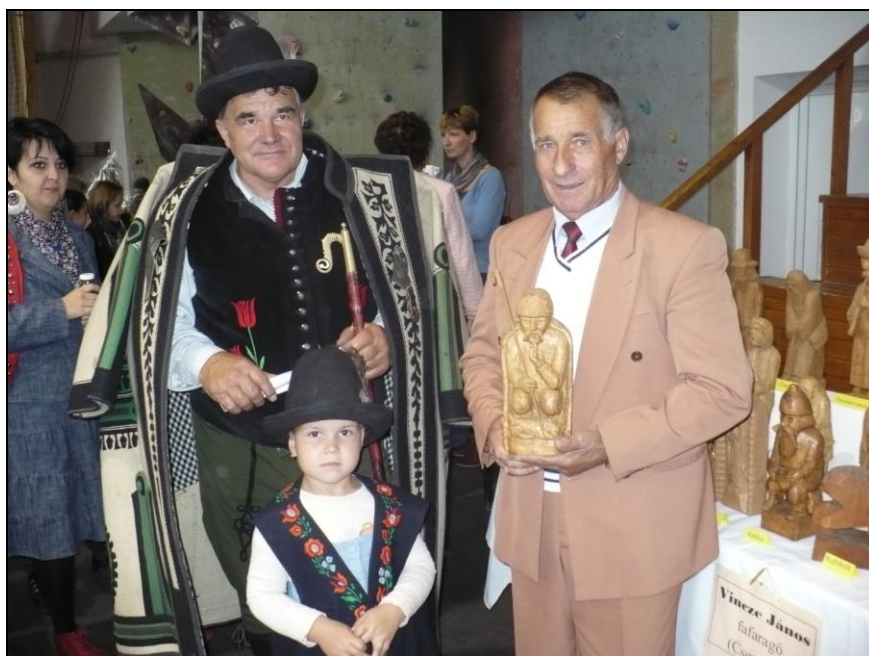
Juhászok élőben és szoborban