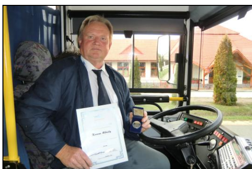
Az 1.250.000 km-es elismeréssel