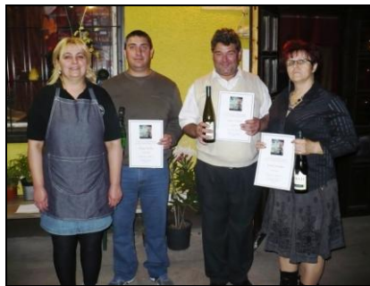
Az első három helyezett