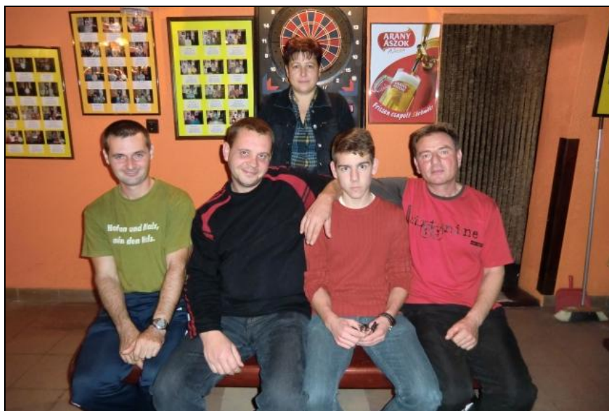
A verseny szervezője a bajnoki címet elértekkkel

A dupla be-kiszállós 301 most is sokaknak nehéznek bizonyult, nehezen tudták megkezdeni a pontszámok csökkentését. A