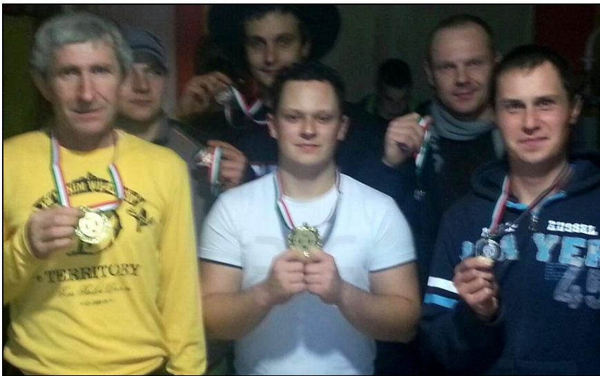
A csocsó bajnokság érmesei