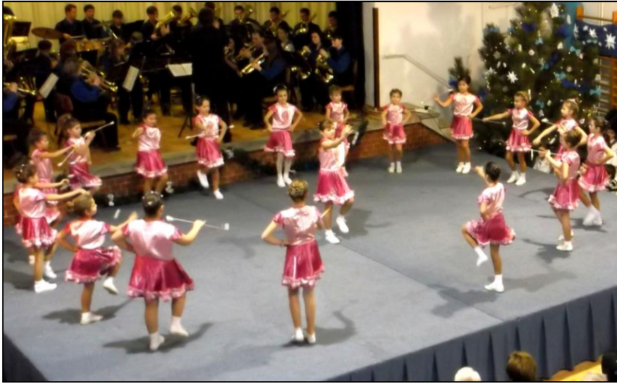
A Holdfény mazsorett csoport produkciója