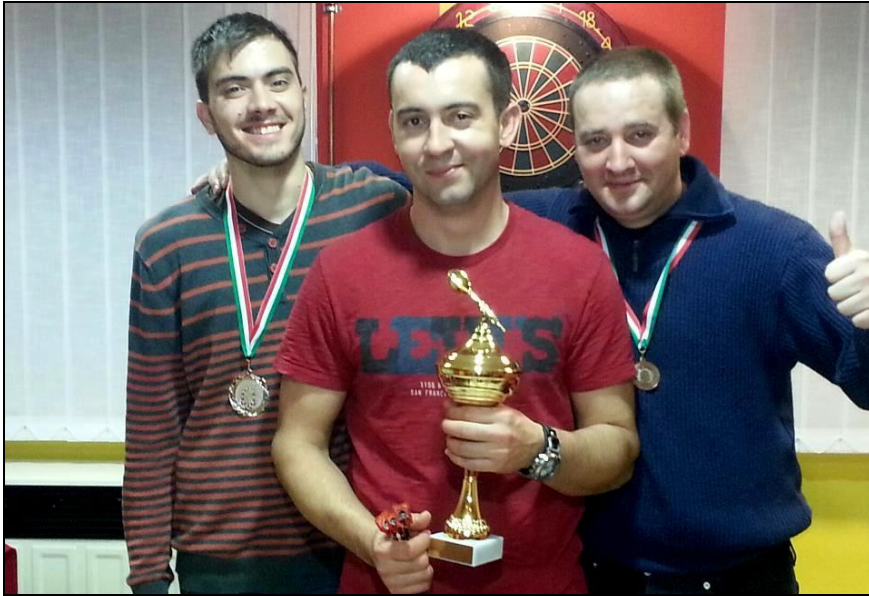
A darts bajnokság első három helyezettje