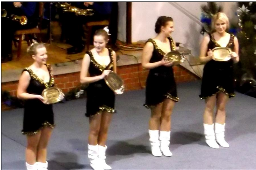
15 éve táncoló „ifjúsági” mazsorették elismerése