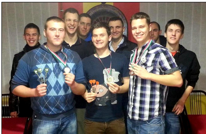
„Amatőr” dartosok a versenyen