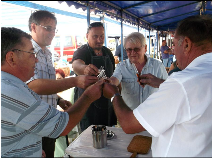
„Ampullában” mérték a rövid italt