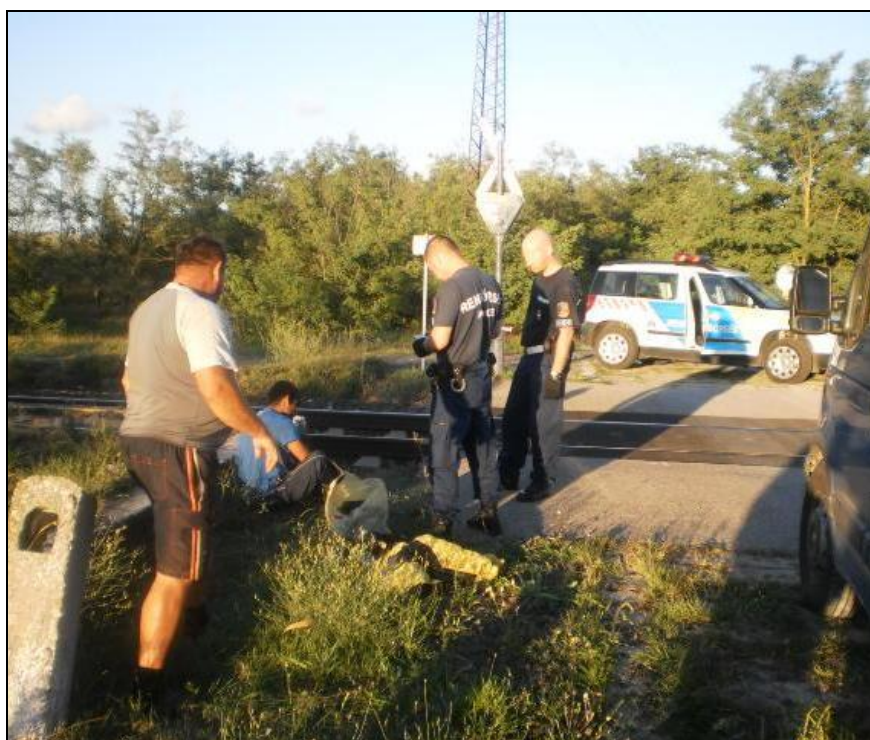
Intézkedik a rendőrség