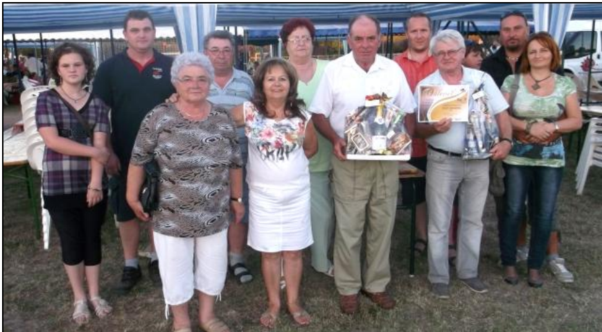
Segédek és szurkolók az eredményhirdetés után