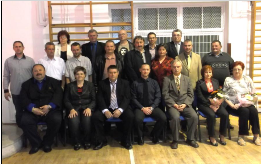
A csengelei polgárőrök csoportképe