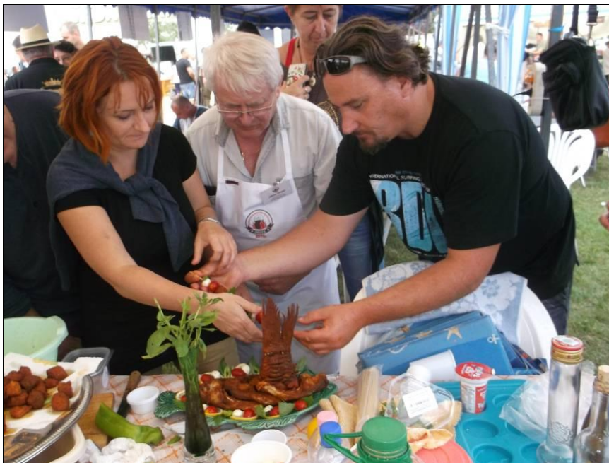
Készül az aranyérmes sülthalas tál