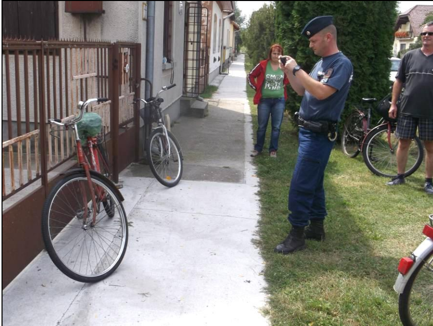
A kerékpárokról fényképes adatbázis készül

A Kisteleki Rendőrkapitányság néhány hónappal ezelőtt megkezdte a kerékpárok önkéntes regisztrálását. A néhány percig tartó eljárás során speciális, sorszámozott matrica kerül a jármű vázára, fotót készítenek a járműről, a tulajdonos pedig egy igazoló kártyát kap a rendőrségtől.