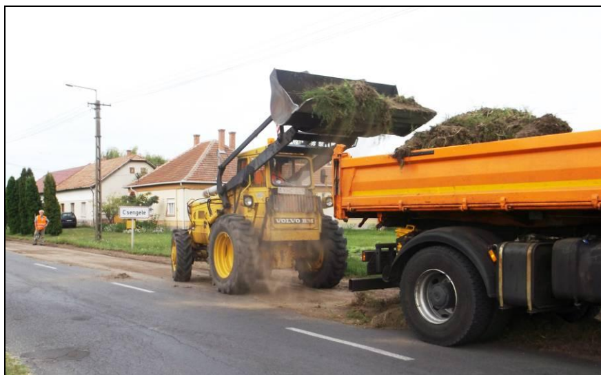
Gyalulják az útpadkát a falu szélén

A Csengelére jellemző talaj miatt a műutak melletti útpadkáknál összefújja a szél a homokot. Néhol 20-25 cm-es “dombok” szegélyezték az utakat, megakadályozva az esővíz lefolyását. Az így kialakult pocsolyák már a közlekedés biztonságát is veszélyeztetik.