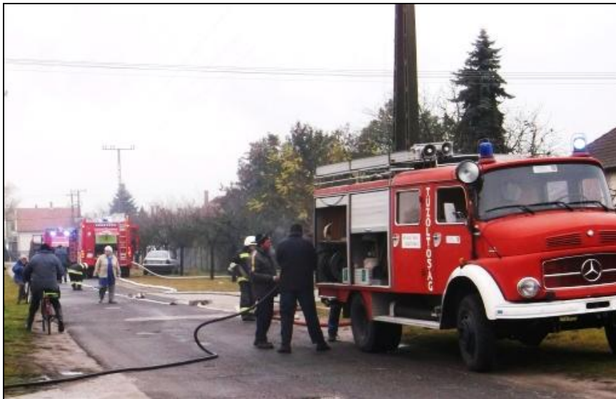
Három tűzoltó kocsi vonult a helyszínre