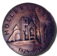
Möller Emlékérem 2010 Felhívás Möller emlékérem adományozására