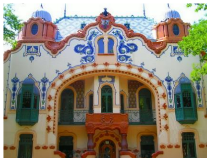
Első nemzetközi konferencia a kulturális turizmusról Subotica(Szabadka) 2009