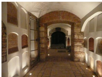
A Pesti Szent Péter ferences templom, kripta, és a Batthyány emlékhely története