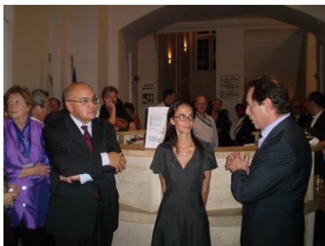
Tanácsadó Testületi Ülés Málta 2009