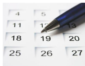
Emlékezzünk rá, hogy... Rejtett évfordulóink