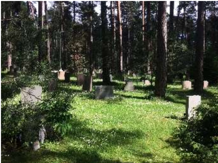
Hangulat az erdei temetőben

Építészként a Sigurd Lewerentz és Gunnar Asplund által tervezett épületek is kiemelkedőek. Két régi ravatalozójukba is bejutottunk, amelyek egészen varázslatos terek, és a XX. század első felének méltán nemzetközi hírű, kiemelkedő műalkotásai. A hely szellemének megerősítette azt a gondolatot, hogy bár a virtuális világban sok minden átélhető és elérhető, de az építészeti tér teljes átélése és megértése aligha, hiszen a térforma minden érzékszervvel való érzékelése mellett ehhez hozzá tartozik a jelen levő emberek mozgása, a hangok, az illatok térbeli érzékelése is.