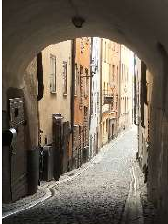
Jellegzetes Stockholm belvárosi utca

Utunkat a világörökségi címmel büszkélkedő temetőben, Skogskyrkogårdenben zártuk. A temető a XX. század első felében épült ki a város déli peremén egy faültetvény helyén, amelyet – úgy döntöttek – mégsem vágnak ki. Az öreg fenyőerdő fái között megbújó sírok sajátságosan festői látványt nyújtanak. A temető kiegészül sírok nélkül meghagyott markáns tájképi elemekkel is, amelyek valóban különleges helyé teszik.