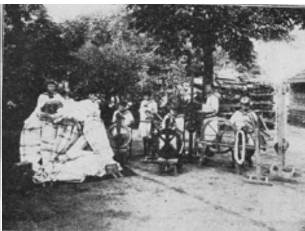
6. kép Vetőfonál készítése