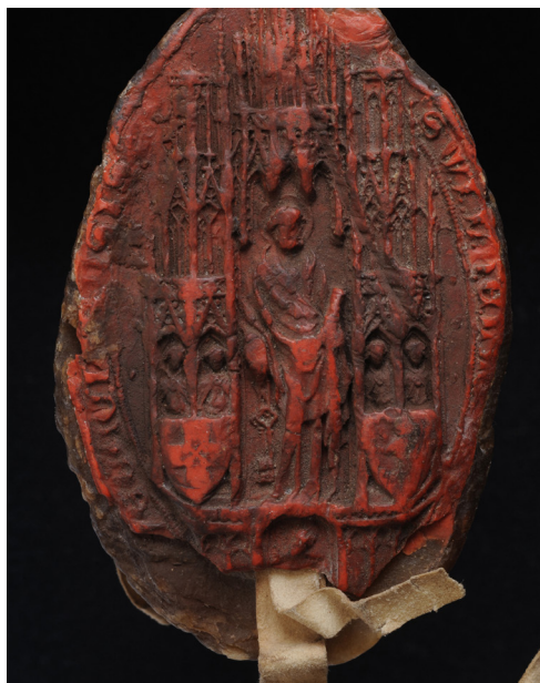
2. kép – Vilmos püspök pontifikális pecsétjének lenyomata