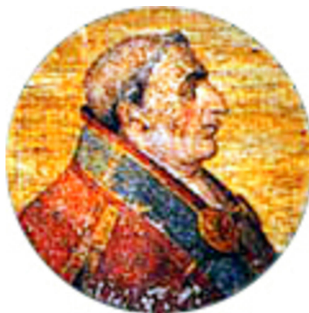
8. kép – II. Pál pápa (1464–1470)