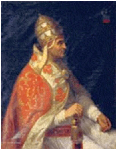
1. kép – V. Orbán pápa (1362–1370)