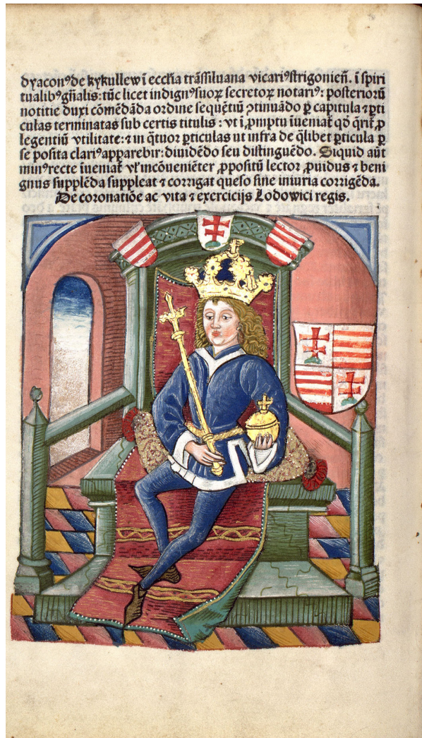
3. kép – Nagy Lajos király (1342–1382)