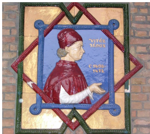
9. kép – Vitéz János esztergomi érsek (1465–1472), Taiszer János domborműve a szegedi pantheonban