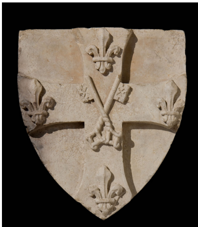
2. kép – Vilmos püspök címere, amely a Pécsi Tudományegyetem mai címerének alapjául szolgál