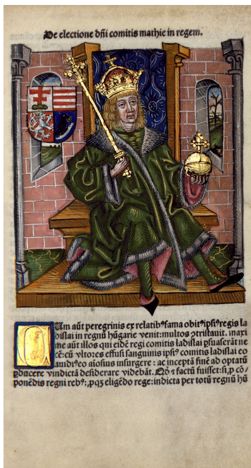
7. kép – Mátyás király (1458–1490)