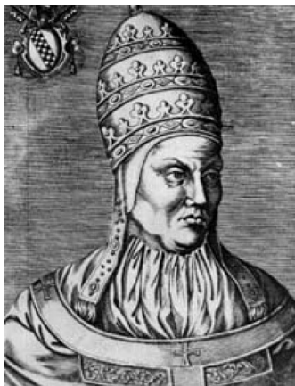
5. kép – IX. Bonifác (1389–1404)