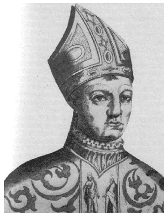
6. kép – XXIII. János (1410–1415)