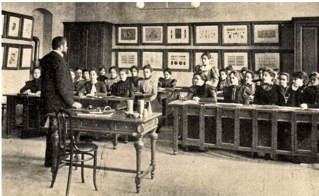
11. kép – Leckeóra a leánygimnázium nyolcadik osztályában

lányok érettségi vizsgára bocsátását hazánkban mások mellett például egy olyan rajz tette nevéssé, amely nem csupán a lányokat, hanem a gimnáziumi tanulás lehetőségét és több egyetemi kart előttük megnyitó, az élclapokban többször „szereplő” Wlassics Gyula