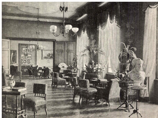
5. kép – Az Országos Nőképző-Egyesület társalgó-terme

terem, konyha, hálóterem), valamint az ott tanuló diáklányokat (4. kép). Többször is találkozhatunk a lapokban az egyesület nagyúri pompával berendezett szalonjának a főtájával is: ennek a belméretei, a búturai, lámpái, függőyei, a falakon elhelyezett képei, a porcelánjai, a szobrai igazán lenyűgözőek (5. kép).