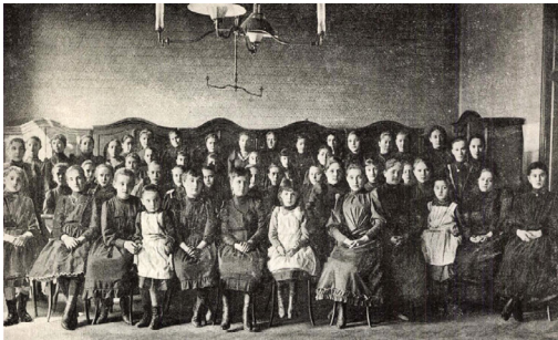
1. kép – Az Országos Nőképző-Egyesület intézete növendékeinek csoportozata egyik tanteremben

A tématerület feltárásához a kutatás jelenlegi szakaszáig a könyvtárakban és az Arcanum adatbázisában, illetve az Országos Széchényi Könyvtár (OSZK) Digitális Képtárjában elektronikus formában elérhető 19. századi hetilapok és folyóiratok sajtófotó-, grafika- és karikatúraanyagát használtuk. Az így feltárt, áttekintett és témáját tekintve csoportokra bontott képek alapján megállapítható, hogy a 19–20. század fordulóján az Országos Nőképző Egyesület tevékenységéről és ennek első, érettségi vizsgát adó leánygimnáziumi képzéséről a legfontosabb forrásaink közé tartoznak az egyesületi tagokat, az iskoláikban, a főzőtanfolyamaikon tanuló diáklányokat, a tanáraikat, továbbá a taneszközeiket, az is-