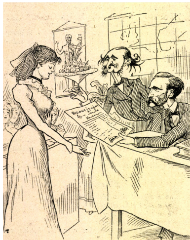
14. kép – Leánygymnázium

kultuszminisztert is kifaragta (12. kép). Ugyancsak ő volt a karikatúrák főszereplője az érettségiző lányokról szóló élcelődések közepette a századfordulón (13. kép és 14. kép).