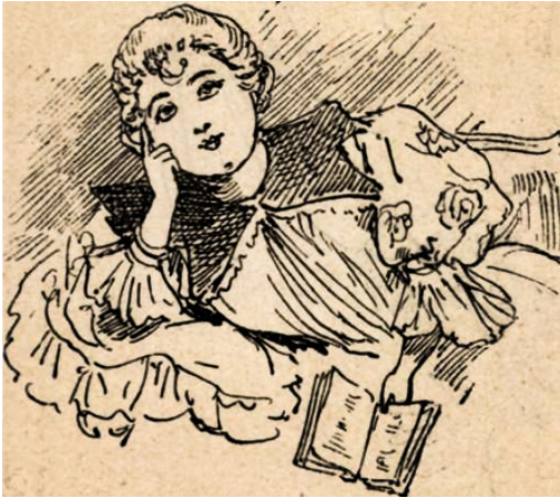
17. kép – Czukros Baba