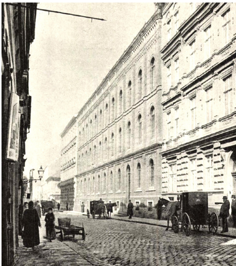
3. kép – Az Országos Nőképző-Egyesület épülete Budapesten, a Zöldfa-utczában (Ellinger Ede fényképe után)

koláikat, a tantermeiket bemutató képek (1. kép, 2. kép). Ezekből az 1890-es években, amikor Wlassics rendeletével lehetségessé vált az érettségi adó leánygimnázium szervezése, különösen sokat közöltek a képes hetilapok, főként és kiemelten az Új Idők és a Vasárnapi Újság . Ahogy fentebb részletezve kifejtettük, az Egyesület budapesti, Zöldfa utcai iskolája lett az a helyszín, ahol a korabeli Magyarországon első ízben indult olyan lányosztály, melynek tagjai aztán majd 1900-ban érettségi vizsgát tehettek. A sajtóban többször közöltek képekkel illusztrált leírást erről az intézményről, bemutatva épülete nagyon impozáns utcafronti homlokzatát (3. kép), belső helyiségeit (tan-