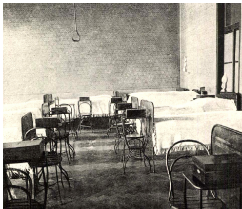
4. kép – Az Országos Nőképző-Egyesület Intézete: A bennlakó növendékek egyik hálóterme