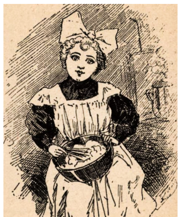
15. kép – Czukros Baba

A hazai humorisztikus lapok közül a Bolond Istók című hetilap volt az a dualizmus korában, amelyik szöveges és rajzos formában is hétről hétre, két évtizeden át élcelődött az Országos Nőképző Egyesület Zöldfa utcai leányiskolájában tanuló diákokon. Ehhez egy állandó karikatúrafigura is társult, ez a vizsgált időszakban rajzos megjelenítési formájában csak néhányszor változott: a karikatúrán ábrázolt diáklányt a „Czukros Baba” névvel illették, és a kezében habüsttel és habverővel, habos fehér kötényben és masnival a hajában ábrázolták (15. kép), pontosan úgy, ahogyan a főzőtanfolyamokon készült fotókon láthatjuk a lányokat (16. kép). Ezek a rajzok és a hozzájuk kapcsolódó szövegek