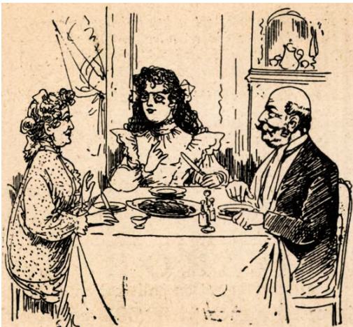
19. kép – Egy felsőbb állami leány

azt a véleményt közvetítették, hogy bármennyire is van jogi értelemben lehetőségük a nőknek arra, hogy gimnáziumba járjanak és érettségi vizsgát tegyenek, a fő feladatuk mégiscsak a sütés-főzés, a háztartásvezetés és a gyermeknevelés. A „Czukros Baba”-karikatúrákhoz kapcsolódó szövegek a századfordulón hétről hétre azt is sugallták emellett, hogy a vizsgákra készülő leányoknak a tudományoknál fontosabb kérdés és téma a szerelem és a divat, és hogy gondolataik a latin helyett inkább a romantikus olvasmányok, a fiúk és az új ruhák körül forognak. (17. kép és 18. kép) Ez a téma annyira kinőtte magát a lapban, hogy az