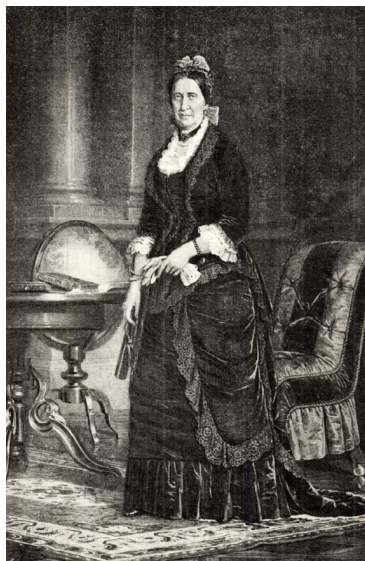
6. kép – Veres Pálné, az Országos Nőképző-egyesület elnöke (Barabás Miklósnak az egyeteli ház dísztermében levő festménye után)

Fontosak továbbá azok az ábrázolások, amelyek az egyesület létrehozóit, vezetőit mutatják be: ők voltak azok, akik nagyon sokat tettek annak érdekében, hogy a lányok számára is lehetségessé váljon az érettségivel záruló, ezzel az egyetemi képzés lehetőségét is megteremtő tanulás. A róluk készült portrék a neveléstörténeti, nőtörténeti szakmunkákban inkább illusztratív jelleggel szerepelnek, és nem képezik az elemzés részét, de egyes esetekben akár ez utóbbi is megvalósítható a segítségükkel. Elemzési szempont lehet például az, hogy hol, milyen háttér előtt, milyen tárgyak mellett készült a portréfotó, hogy milyen volt a ruhája, hajviselete egy-egy személynek.