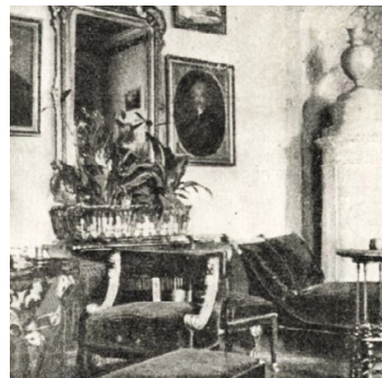
8. kép – Veres Pálné dolgozó-szobája