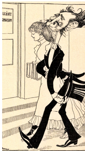
12. kép – Faragó József: A leánygymnázium felavatása