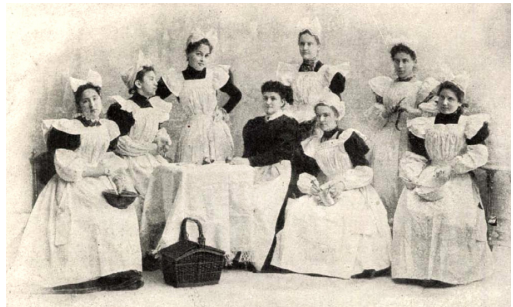
2. kép – Az Országos Nőképző-Egyesület Intézetéből: A főzőtanfolyam növendékeinek csoportja (Erdélyi fényképe után)