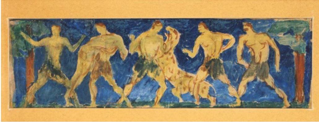
2. kép – Kernstok Károly: Ősvadászok (1912) 204

Ez a fajta, a „mens sana in corpore sano” római eszményét idéző neveléskoncepció egyfajta gyakorlati következtetést von le abból, ami az Ifjak vagy a Lovasok a víz partján című képeken a növekedés tényének és eszméjének összekapcsolása révén már megfogalmazódott, s azt sugallja, hogy ha a „szellem” alakító munkája anyagi közegének tartjuk a biologikumot, nagy figyelmet kell szentelni a testi funkciók kielégítésének. Sőt, a gyermektanulmányi mozgalom gyermekkoncepciójának tükrében e mű üzenete, hogy a szellem uralomra jutásának záloga a gyermek és az ifjú ösztöntartományainak mozgósítása, hiszen a gyermekkort meghatározó teremtő életakarat cselekvést és szabadságot követel. 205