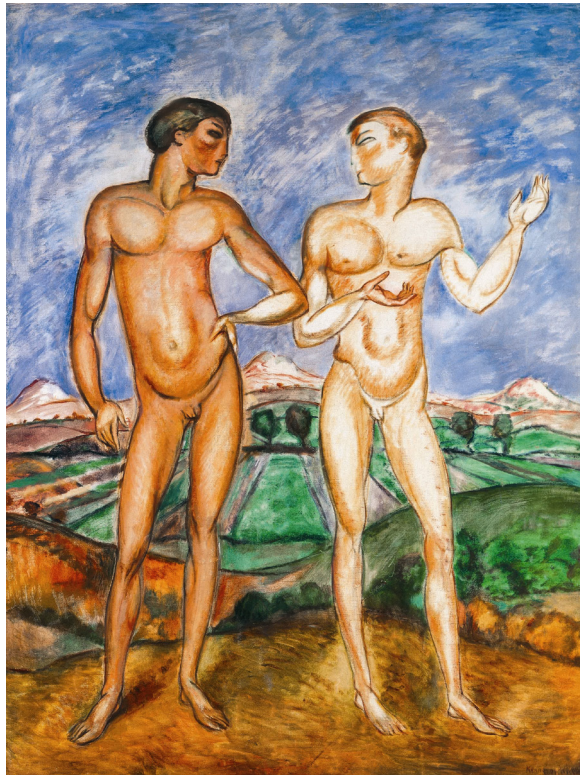
1. kép – Kernstok Károly: Ifjak (1909) 133

a has-, gyomor-, köldök- és vállbrázolás is rokonítja Kernstok figuráit. A hangsúlyosan körvonalazott szemek, illetve a bal oldali alak törzsének alakítatlansága azonban már Gauguin bennszülött-képeit idézik (ezzel adva hangot a természetihez való visszatérés imperatívuszának), de utalnak a kurosfurák alapos megfigyelésére (lásd Sunioni kuros, Kr. e. 610–590 k.) vagy bizonyos óegyiptomi szobrászati előképekre is. Az óegyiptomi szobrászattal való párhuzam elsősorban a szemek (és szemöldökök) formája és hangsúlyos kontúrjai, valamint a „legnagyobb felületek törvényéhez” hasonlatos komponálási mód okán merül fel, mely ráadásul – mint majd később látni fogjuk – az örökkévaló értékek állandóságára alapozott statikus világregendbe vetett hit 131 okán (melyet e szerkesztési mód átételes kifejezés) eszmei rokonságot is mutat az óegyiptomi és a transzcendencia-keresésre irányuló kernstoki felfogás között. A kurosfurák és az óegyiptomi szobrok egyébként Gauguin és az ókori művészet iránt fokozottan érdeklődő Kernstok számára ugyanúgy inspirációs forrást jelenthettek. 132