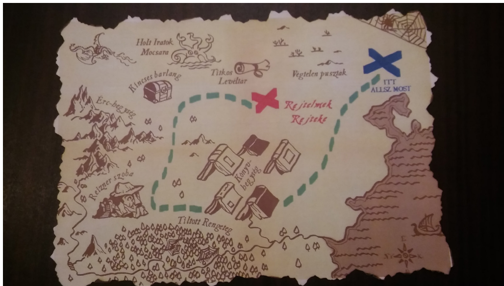
1. kép – A szabadulást segítő térkép

még egy verziót a játékból, így akár vetélkedni is tudnak egymással a csoportok. A feladatok bár nagyon hasonlóak, a csapatok mégsem tudnak lesni a másiktól, nem tudnak segíteni a másikat, de nem is hátráltatják egymást. Minden helyszínen, amely tulajdonképpen munkatársaink irodája, egy zárt borítékban várja őket a feladat, a megoldáshoz minden szükséges segédeszköz oda van készítve (könyvrészletek, nagyító, jegyzetomb), a sikeres szabaduláshoz nincs szükség sem telefonra, sem internetre. Azonban nem hagyjuk őket teljesen magukra, bármikor kérhetnek tőlünk segítséget.