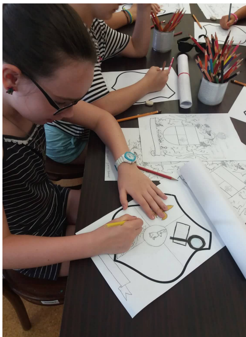
7. kép – Családi címer készítése

Tapasztalataink és a visszajelzések alapján elmondható, hogy a résztvevők nagyon élvezik a játékot, pozitív élményekkel gazdagodnak, mindeközben észrevétlenül tesznek szert levéltári alapismeretekre, a levéltári miliő felkelti az érdeklődésüket a régmúlt dolgok iránt. Az a tendencia, hogy a pedagógusok, akik egyszer hoztak csoportot, évről évre visszatérnek osztályaikkal. Ezt konkrét számadatok is bizonyítják: az