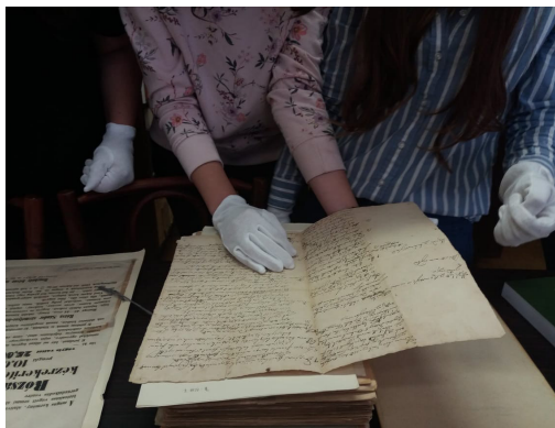
5-6. kép – Eredeti levéltári iratok megtekintése

oldható a diákok saját eszközeivel, mégsem elvárható, hogy mindenki rendelkezzen okostelefonnal közlők. A levéltár infrastrukturális háttere meghatározza a levéltár-pedagógiai tevékenységet, mindemellett úgy gondoljuk, hogy a hagyományos, papíralapon történő információkeresés megtanulása is kiemelten fontos, mert rávezet, hogyan tudjuk nagyobb mennyiségű szövegben megtalálni a nekünk szükséges adatokat. Játék közben kiszakadnak a virtuális világból, mert kézzel fogható ingerek érik őket, és nem csak egy kivetítő vagy egy kijelző szolgáltatja számukra az információkat. A felfedező módszer segítségével építünk a résztvevők természetes kíváncsiságára, ahol az előre megtervezett útvonalon haladva az írott segédanyag felhasználásával kérdésekkel, játékos feladatokkal szerzik meg a kívánt ismereteket. Ez a módszer fejleszti az önálló gondolkodást, és a tanulók önálló tevékenységére alapoz. 6 A motiváló témájú feladatok során számítunk a diákok fizikai és szellemi aktivitására, biztosítva egy olyan tanulási közeget, ahol szabadon próbálkozhatnak, hibázhatnak, kipróbálhatják ötleteiket. 7 (7. kép)