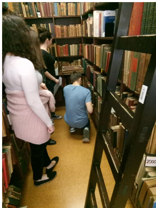
4. kép – Az utolsó pillanat a kulcs megtalálása előtt

A foglalkozást a rendelkezésre álló időtől és az igényektől függően vagy egy kvízzel zárjuk, ahol mintegy ellenőrizzük a szabadulás során elsajátított új ismereteket és izgalmas helytörténeti, illetve történelmi kérdésekkel is találkozunk, és/vagy ritka, figyelemfelkeltő, értékes levéltári iratokat (szegedi tanácsülési jegyzőkönyv, címeres oklevelek, nemeslevelek, kéziratok, fényképek, plakátok, iskolai értesítők stb.) csodálhatnak meg. (5–6. kép)