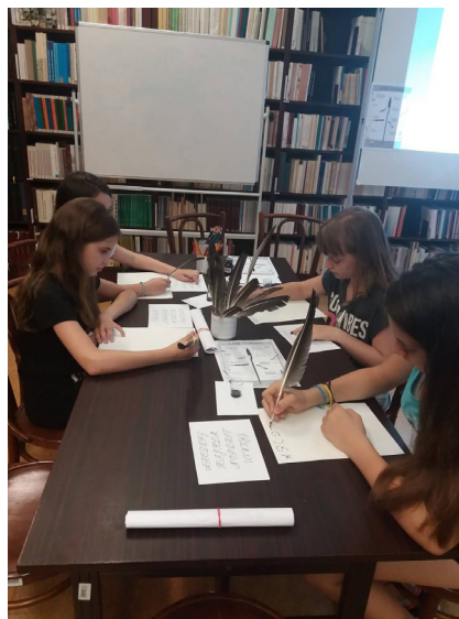
8. kép – Írás lúdtollal

Mind egyik program alakítható: a foglalkozások időtartamát és a nehézségét a felmerült igényekhez és a korosztályhoz tudjuk igazítani. A legkisebbektől kezdve a legnagyobbakig tartottunk már levéltári órákat: a 2018-ban megrendezésre kerülő táborunkban a legfiatalabb résztvevő 8 éves volt, gyereknap programunkon óvodások is jelen voltak, de a rendszeres levéltár-látogatók között szerepelnek az egyetemisták is (történelem, régész, filozófia és pedagógia szakos hallgatók), a Múzeumok Éjszakáján és a Kutatók Éjszakáján pedig főleg felnőttek vettek részt. Az egyetlen fizikai korlát, amely megnehezíti a foglalkozások zavartalan lefolyását, a hely szűkössége. A foglalkozásokat a levéltári könyvtárban szoktuk tartani, ugyanis nincs a levéltár-pedagógiára egy külön kijelölt, felszerelt helyiség. Ha nagy létszámú csoport jelentkezik, akkor a velünk egy épületben működő városi könyvtárral párhuzamosan, csoportbontásban tartjuk az órákat.