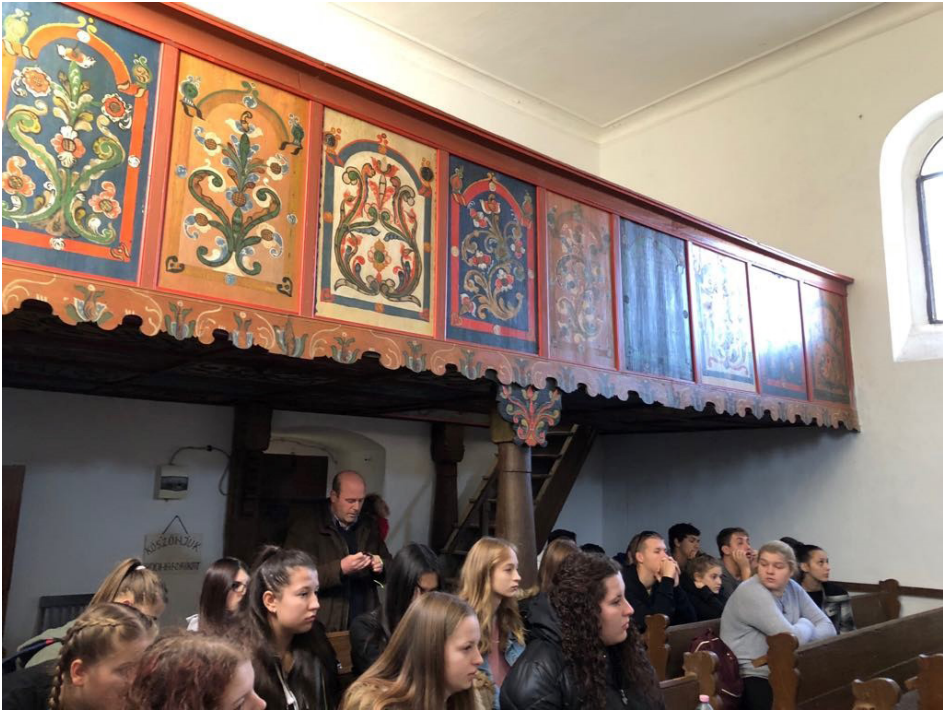
6. kép – A PRK Internátusának diákjai Kémesen a reformátusok hímes templomában 2018 őszén