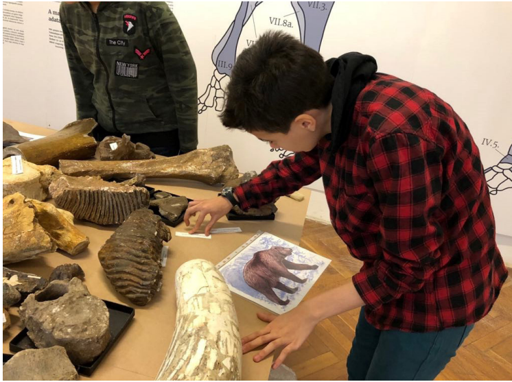
2. kép – Látogatás a Janus Pannonius Természettudományi Múzeumban. A múzeumi tárgyak leírása 14

A BREL-ben szintén kihasználjuk a levéltár adta tanulási környezetet: közösen megnézzük a raktárakat, kézbe vesszük a levéltári dobozokat, majd a tanulók összeírják a polcokon lévő jelzeteket. A gyűjtőkör fogalmának bevezetéséhez tisztázni kell a levéltár és az irattár közti különbséget is, ami 12 éves tanulók esetében nem egyszerű feladat. Ehhez különböző típusú információforrásokat tartalmazó szövegeket kapnak, melyeket fel kell dolgozniuk egy feladatlap segítségével. A kritikus gondolkodást elősegítő feladat megoldását poszter formájában rögzítik (3. kép).