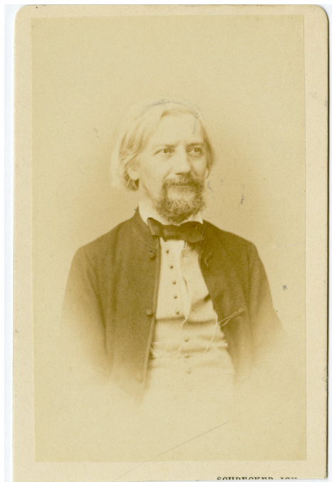
12. kép – Henszlmann Imre portréja

Az 1840-es, 1850-es években a hosszú expozíciós idő miatt egyáltalán nem volt jellemző a fényképeken való mosolygás, hiszen azt hosszú másodpercekig, kezdetben akár teljes percekig kellett volna produkálni a fényképezőgép előtt. A kimerevített arckifejezés természetellenessége mellett fontos még azt is kiemelni, hogy a portréfestészetre visszanyúló ábrázolási sémák miatt egyáltalán nem volt ildomos mosolyogni a fényképeken a korai időszakban. Ugyan a fénykép a század derekán már teljesen kiszorította a miniatúrfestészetet, annak esztétikai sémáit továbbra is fenntartotta. A fénykép funkciója az emlékezést szolgálta, a megörökítés nemcsak a személyiséget, hanem a társadalmi státuszt is tükrözte. Műterembe menni igazi ritkaságnak számított a század derekán, ennél fogva a fényképészhez látogatók méltóságteljes, tiszteletre méltó külsőt vettek fel. 41 A portréfényképezés esetében a merev arcoknak fontos jelentésük volt, egy akadémikusnál az ünnepélyes megjelenés és arckifejezés még inkább indokolt lehetett, nem csak a társadalmi státuszból kifolyólag, hiszen a fényképalbum egy rendkívül jeles alkalomra készült, az Akadémia vezetőségétől származó felhívó levelek pedig csak erősítették az alkotás hivatalos jellegét.