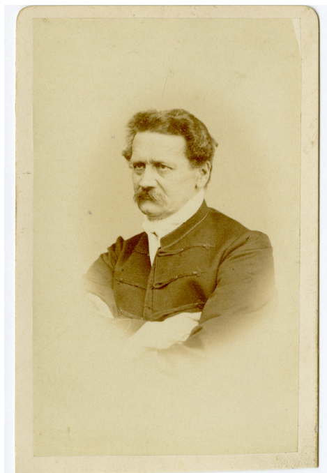
3. kép – Engel József portréja