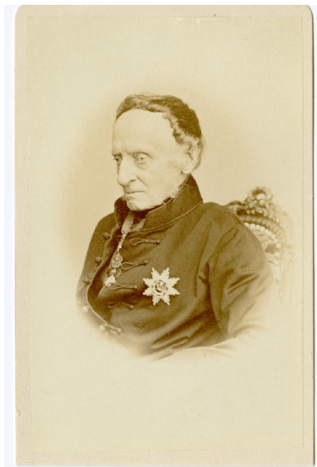
8. kép – Esterházy Pál portréja