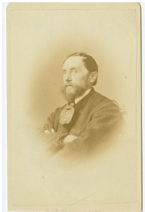
4. kép – Szemere Miklós portréja