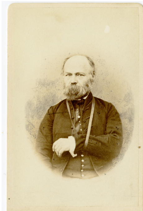
5. kép – Lugossy József portréja

A gyors, kevésbé kimódolt munkának számos jele megmutatkozik a portréképeken. Így például egészen meglepő, hogy az ünnepi díszalbum számára Lugossy József (1812–1884) orientalista akadémikus sérült kézzel volt kénytelen portrét állni, a fényképész egy másik, szerencsésebb beállítással könnyűszerrel orvosolhatta volna ezt az esztétikai malórt. Főleg úgy, hogy bármennyire is az egységes arculat megteremtése lebegett Schrecker művészi szemei előtt, több esetben előfordult, hogy kénytelen volt eltérni az albumra nagy általánosságban jellemző álló beállítástól. Batthyány Fülöp herceg (1781–1870) nagyon idősén, 84 évesen került megörökítésre, róla ennél fogva egy ülő portré készült, a kép azonban nem sikerült valami jól, a fényképész érzékelhetően magasabb állásba helyezte fényképezőgépét az ideálisnál. Hasonlóképp nem sikerült eltalálni a kívánt gépállást Dósa Elek (1803–1867) fényképezésekor, a portrén kitüntetett helyen ezáltal nem az akadémikus arca, hanem felsőruházata látható. Ugyancsak idős korára való tekintettel készült ülő portré