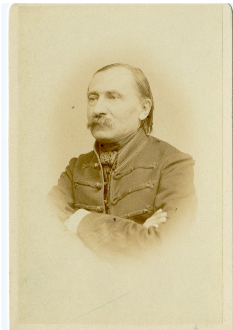
2. kép – Kriza János portréja