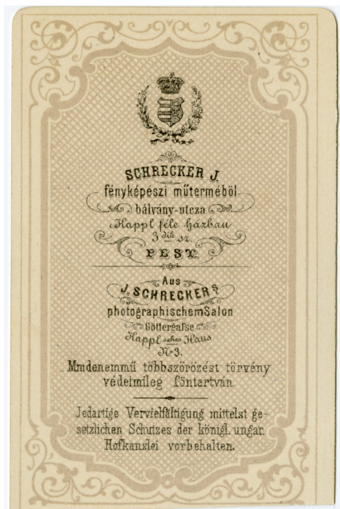
10. kép – A leggyakrabban előforduló verzó

Annak, hogy a portréfényképek nagy gyorsasággal készültek, van egy további árulkodó jele. Az albumban szereplő vizitkártyák a keretből kivehetőek, ebből adódóan láthatóvá válnak a fényképek verzói. A fényképverzók közül öt különböző típusú is felbukkan a fényképalbumban, Schrecker Ignác tehát 1864 novembere és 1865 decembere között legalább ennyiféle verzóval hirdette műtermét. A leggyakrabban előforduló verzón a fényképész műterem címe két nyelven (magyarul és németül) szerepel, a magyar címer, a korona, a babérkoszorú mellett egy díszes ornamentikájú, keretként szolgáló mintázat is látható rajta, valamint két nyelven olvasható a másolást tiltó rendelkezés. A második leggyakoribb verzóról már hiányzik a színes mintázat és a többszörözést tiltó felhívás. A forrásokból ismert, hogy a Magyar Akadémiai Album egy jól behatárolható időintervallumban, egy év alatt készült el, ehhez képest a fényképész nem figyelte a verzók egységes megjelenésére, esetleges, hogy melyik mellképhez milyen típusú verzó párosul a díszalbumban. Talán azzal is magyarázható ez a sokféleség, hogy a hatóság által elrendelt szakmai vizsgálat megállapításai után Schrecker nemcsak a silánynak minősített portrékat készítette el újra, de a képek hátoldalán látható verzón is ráncfelvarrást hajtott végre.