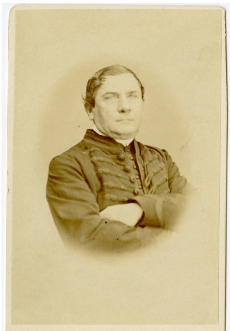
1. kép – Fábian István portréja