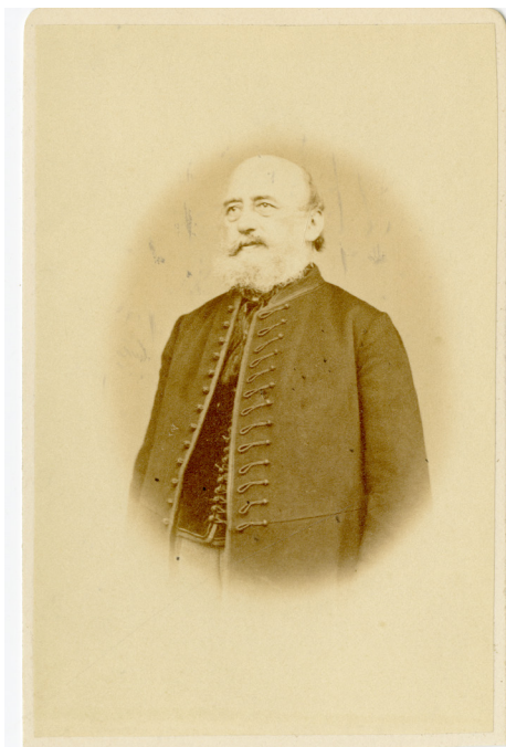
7. kép – Dósa Elek portréja