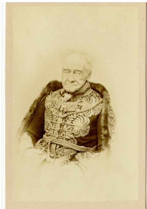
6. kép – Batthyány Fülöp portréja