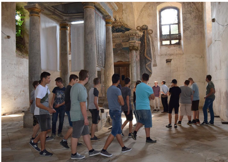
4. kép: Az Ózsinagóga terében