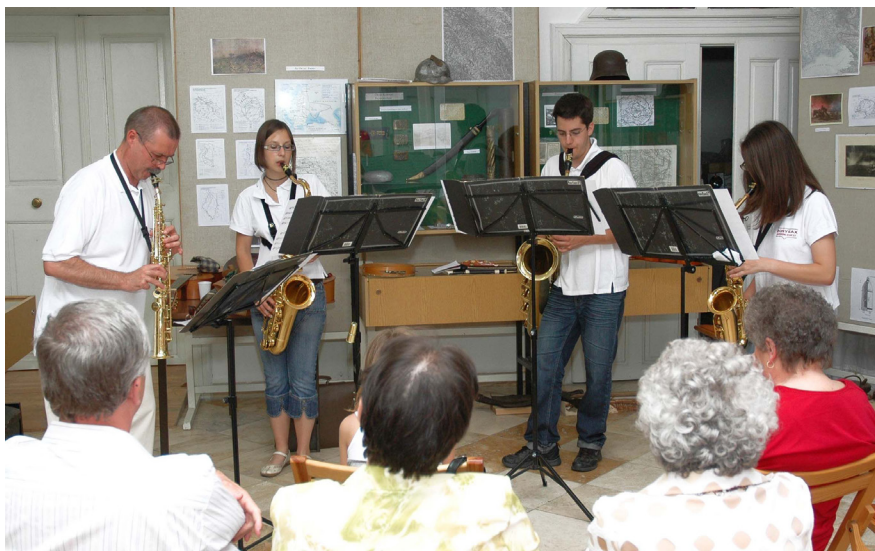
2. kép: A zeneiskola szaxofon kvartette az első világháborús időszak kiállításán

lyiségeinek, intézményeinek, szervezeteinek kiemelkedő szerepét is, figyelmet szenteltek a Völgység kisgyűjteményeire, a nyári idegenforgalom számára is vonzó, látványos tárlatokra.