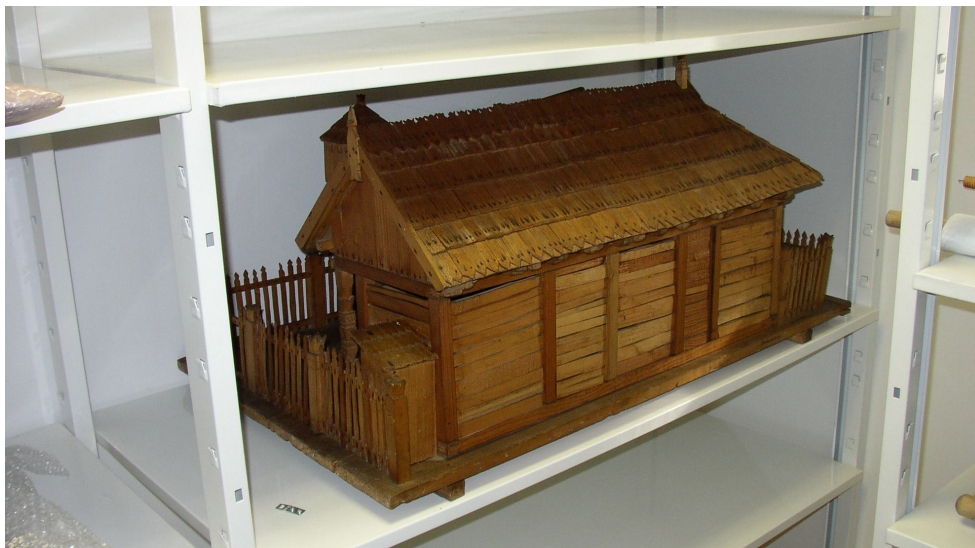
1. kép: Egy tárgy a Bonyhádi Tájmuzeumból: Lőrincz Imre székely ház modellje a modulraktárban

múzeum. Valójában az 1948-as fordulat után sorra felszámolták a székelyek gazdasági és szellemi megmaradását szolgáló szervezeteket. 9