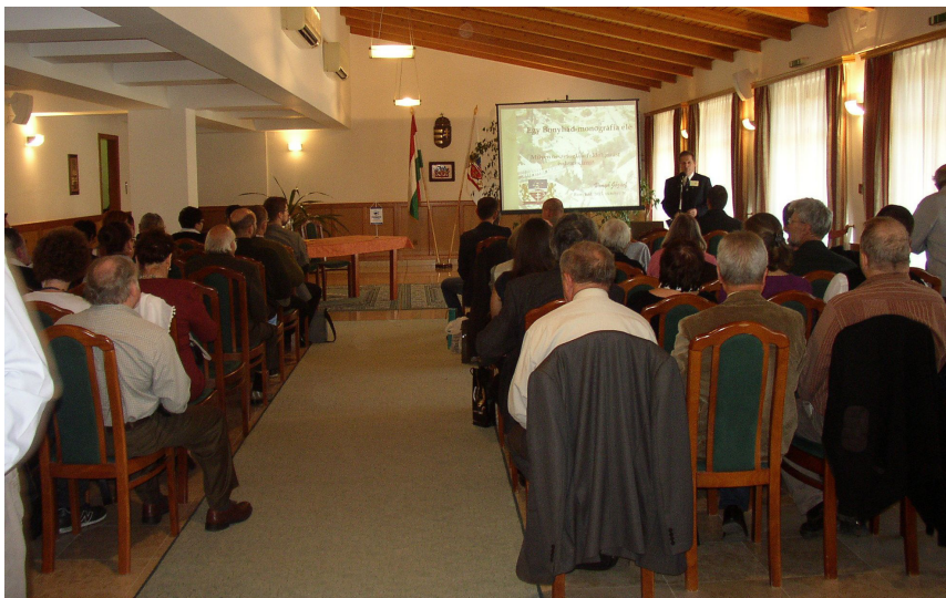
3. kép: A VI. Völgységi konferencia megnyitója a Polgármesteri Hivatalban