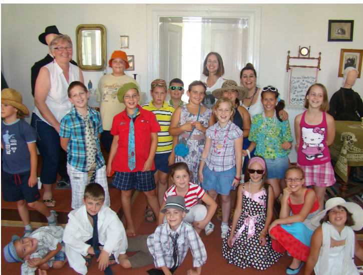
7. kép: A „Kulcsos gyerekek” táborának résztvevői a német szobában 24

„A Völgységi Múzeum új állandó kiállításának szakmai terve 2013–2017” címmel 2013-ban a múzeum igazgatója projekttervet fogalmazott meg. A projekt célja regionális szakmaközi együttműködésben annak közös kivitelezésű előkészítése–tervezése és megvalósítása. Szakmai célcsoportja a megyei múzeumközi munkacsoport tagjai, a régióban élő levéltáros és helytörténész kollégák. A gyűjteményi stratégia, az állagmegóvás, a kiállítási stratégia, a tudományos feldolgozó munka, a közművelődési és továbbképzési középtávú terv mind alárendelődött az új állandó kiállítás megvalósításának. Ez egyben alapja lett az intézmény 2014–18. évi új középtávú stratégiájának. 23