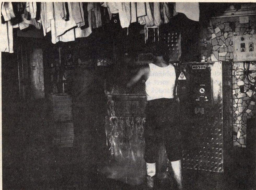
A mosás mindenütt az elítelt dolga

telével pótkeretet kellene biztosítani számára. Ha viszont az intézet a rendelkezésre álló keretből megtakarít, indokolt esetben engedélyezni kell, hogy a fogvatartottak ellátásához szorosan kapcsolódó más feladatok finanszírozására szánhassa az így nyert összeget. E rendszer lehetővé teszi a ruházati gazdálkodás számítógépes feldolgozását is.