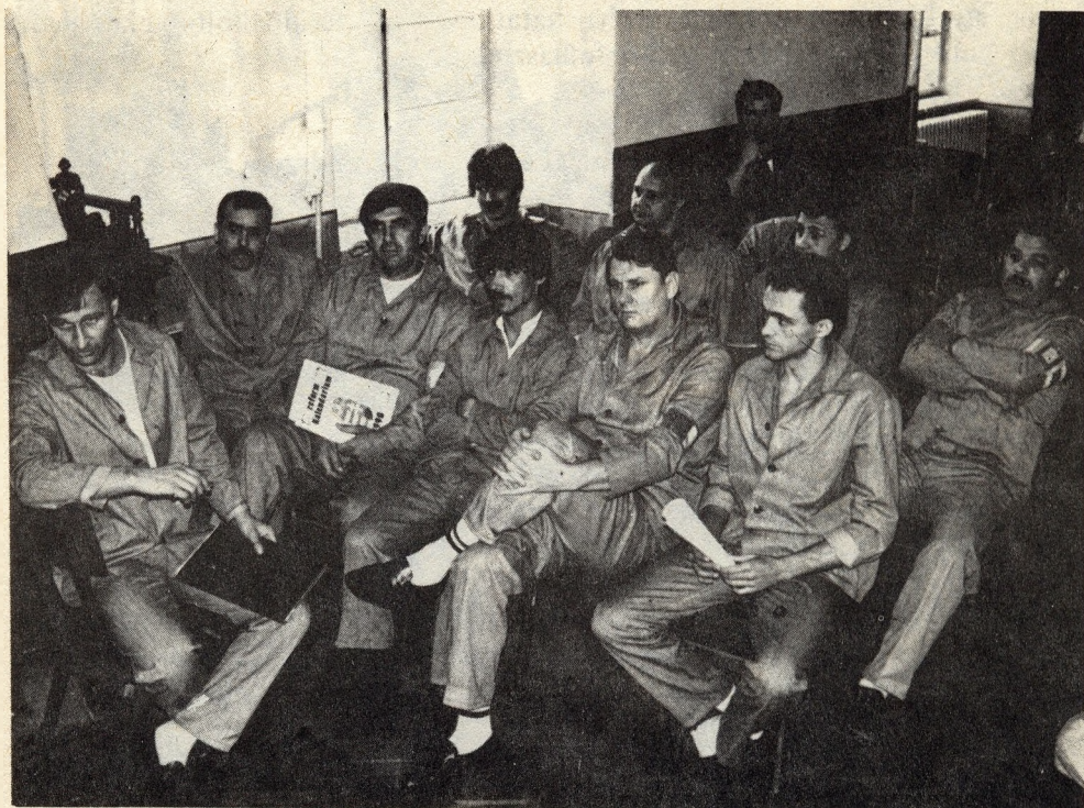
... manapság a „mákos” a divatszín

Az elmúlt időszakban az építő és egyéb munkás alakulatok leszerelése miatt a fegyveres szervektől térítés nélkül vagy igen kedvező áron és nagy mennyiségben vettünk át az elítéltek részére keki színű ruhákat. Ma viszont a költségvetési szorítás következtében a honvédség is takarékosági intézkedéseket vezetett be, ezért azután romlott az átvételre felajánlott anyagok minősége és a méretválasztéka egyaránt. A használt ruhák értékesítése a MH kft-jének kezébe került, most velük kellene előnyös szerződéseket kötnünk.