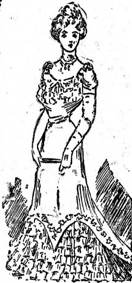
Az elsőn báli öltözet látható, mert hiszen hiába mult el a farsang, ha a leg

De nem akarom az önök jó izlésű olvasónót oktanni. Jól tudják ők, miben hódítanak leginkább. Most csak arról beszélek, hogy mi a legújabb párisi divat és e célra néhány eredeti párisi divat, képet hívok segítségül.