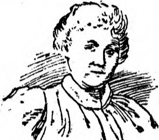
Mrs. May Wright Sewall

A Nők nemzetközi szövete elnöke, nőnköze ez időszerint Ishbel Aberdeen grófnő, aki a kongresszus végével lemond az elnöki tisztéről. A Ladynek nagy érdemei vannak a női nevelésügy körül, különösen Canadában fejtett ki nagy tevékenységet, s minthogy irodalommal is foglalkozik a kingstoni Queens University 1897-ben a doktorcímét adta neki.